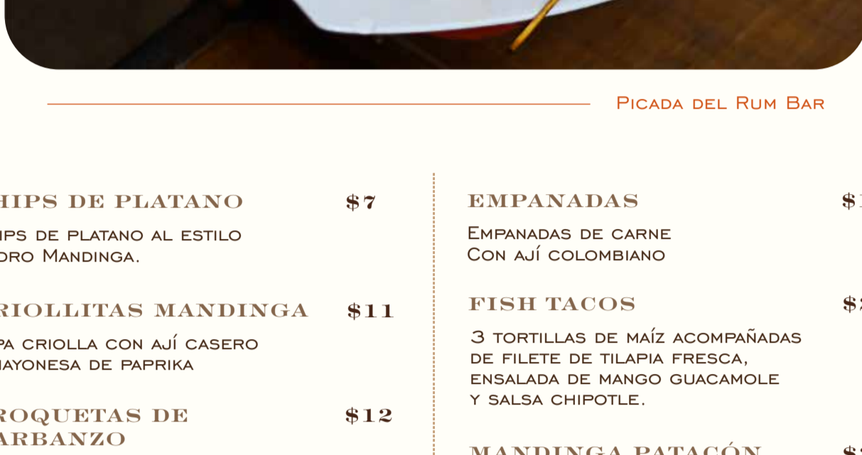
PICADA DEL RUM BAR