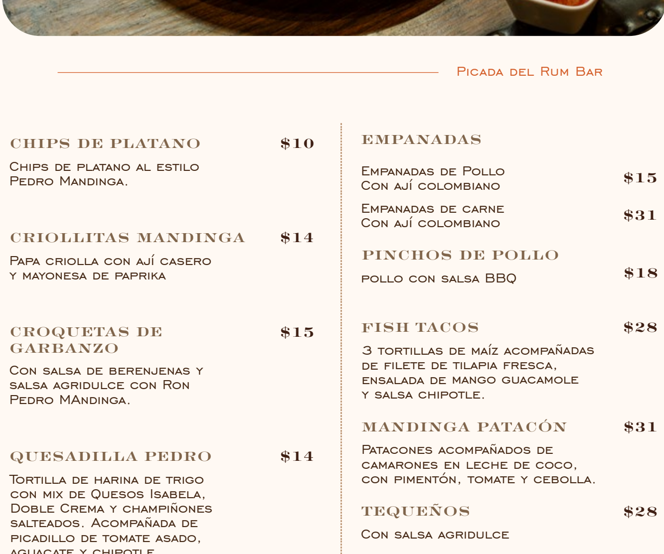
PICADA DEL RUM BAR