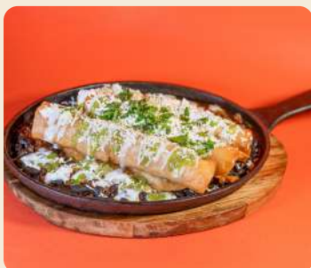
FLAUTAS DE POLLO $10.990