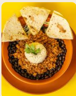
POROTOS CHILMEX $7.990