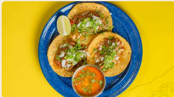
TOSTADAS DE BIRRIA $10.990