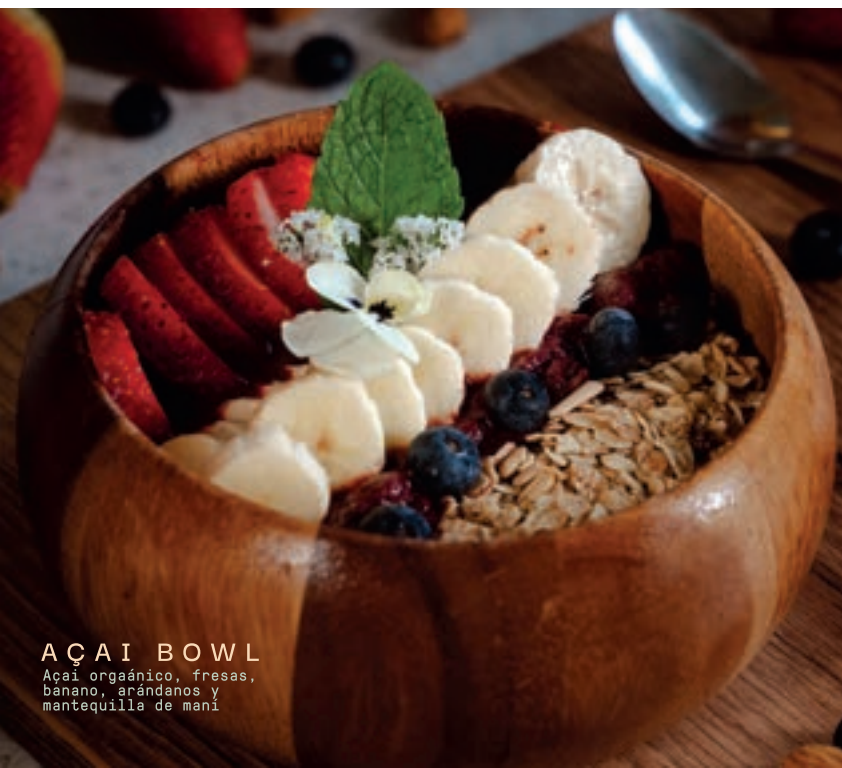
AÇAI BOWL Açaí orgánico, fresas, banano, arándanos y mantequilla de maní