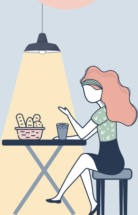
Tabla Apéro veggie , selección de productos veganos para compartir. Acompañada con baguette fresca. $29.000

Tabla Apéro , roastbeef, bondiola ahumada, queso cremoso francés, quesillo, pepinillos, arándanos y mantequilla. Acompañada con baguette fresca. $34.900