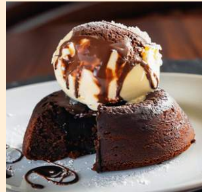
VOLCÁN DE CHOCOLATE