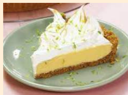
PIE DE LIMÓN