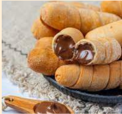
TEQUEÑOS DE CHOCOLATE 8 unidades