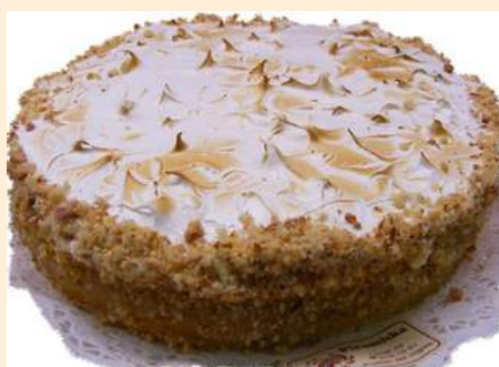
KUCHEN DE MANZANA