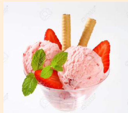
COPA DE HELADO