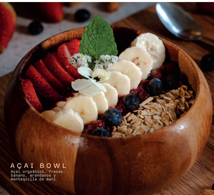
AÇAI BOWL Açaí orgánico, fresas, banano, arándanos y mantequilla de maní