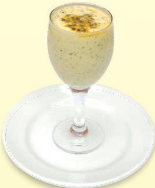
MOUSSE DE MBURUCUYÁ