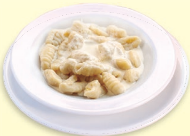
GNOCCHI A LA CREMA