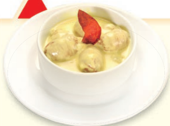
CHORICITOS A LA MOSTAZA