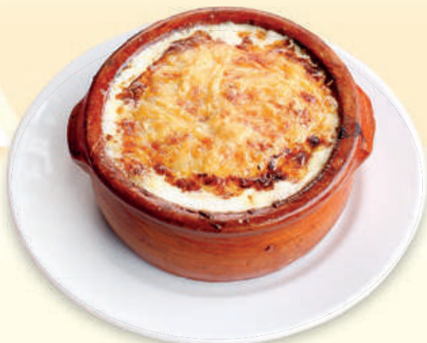
LASAGNA A LA BOLOGNESE