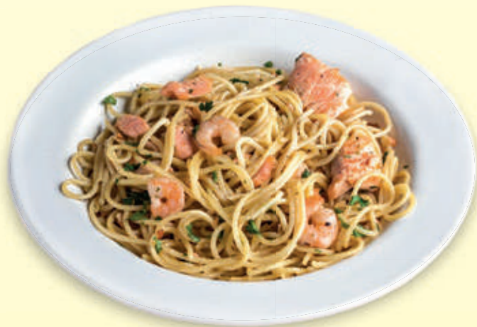
SPAGHETTI AL SALMÓN