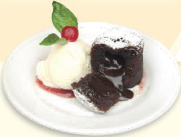
VOLCÁN DE CHOCOLATE