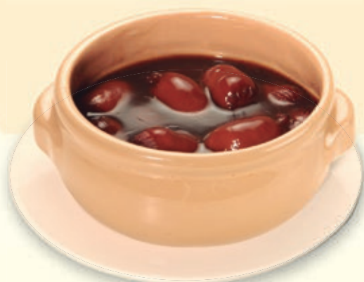
CHORICITOS AL VINO