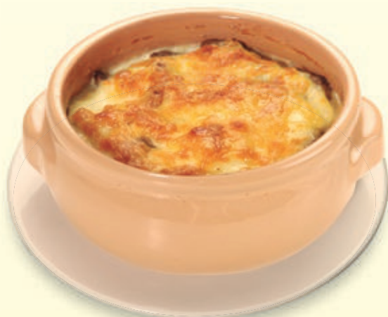
PICADA LOMITO AL CATUPIRY

Exquisitos trozos de lomito vacuno, con queso catupiry fundido.