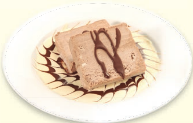
MARQUISE DE CHOCOLATE