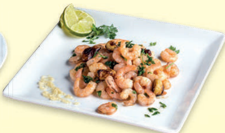
CAMARONES AL AJILLO