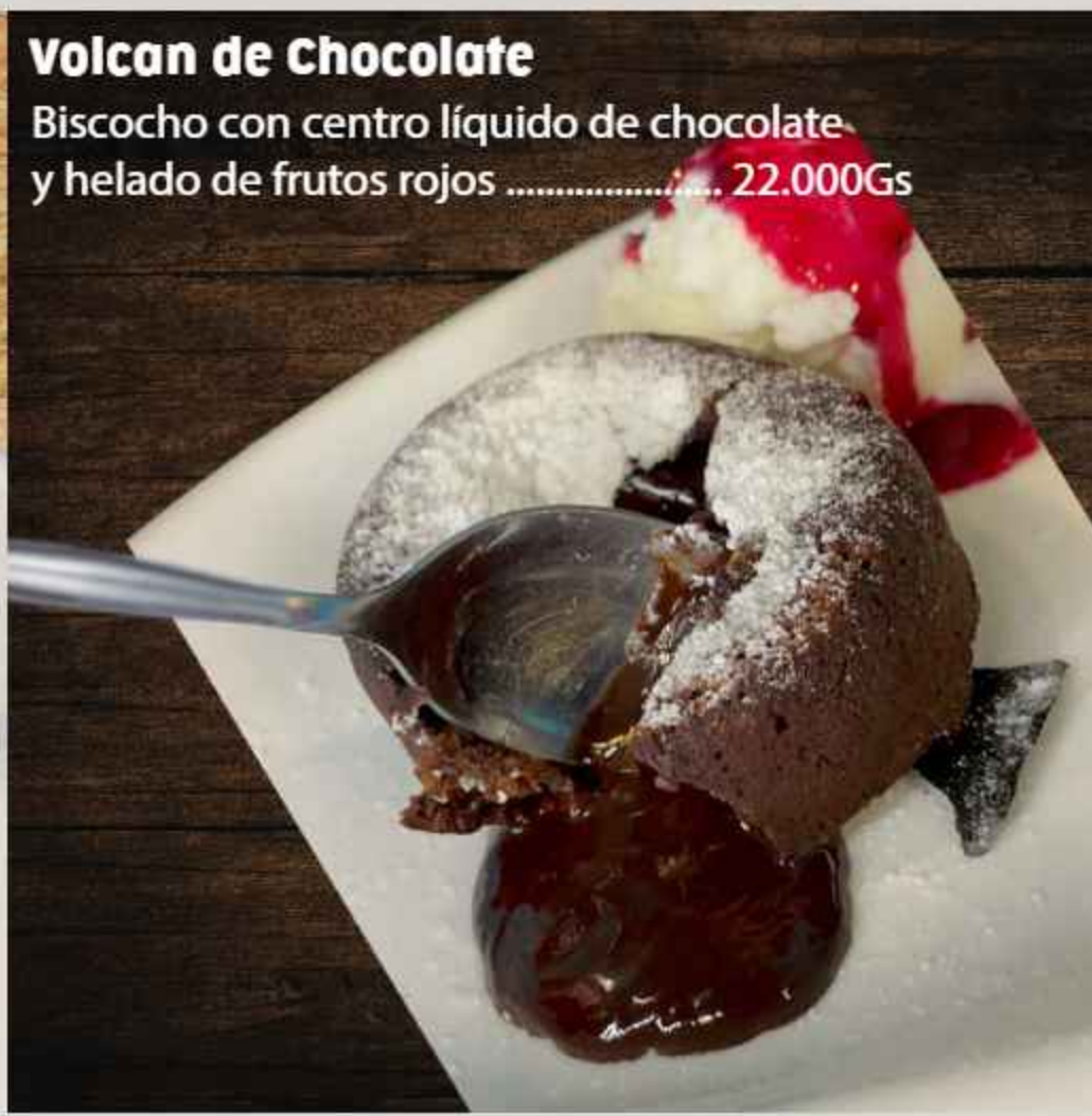
Volcan de Chocolate Biscocho con centro líquido de chocolate y helado de frutos rojos ..... 22.000Gs