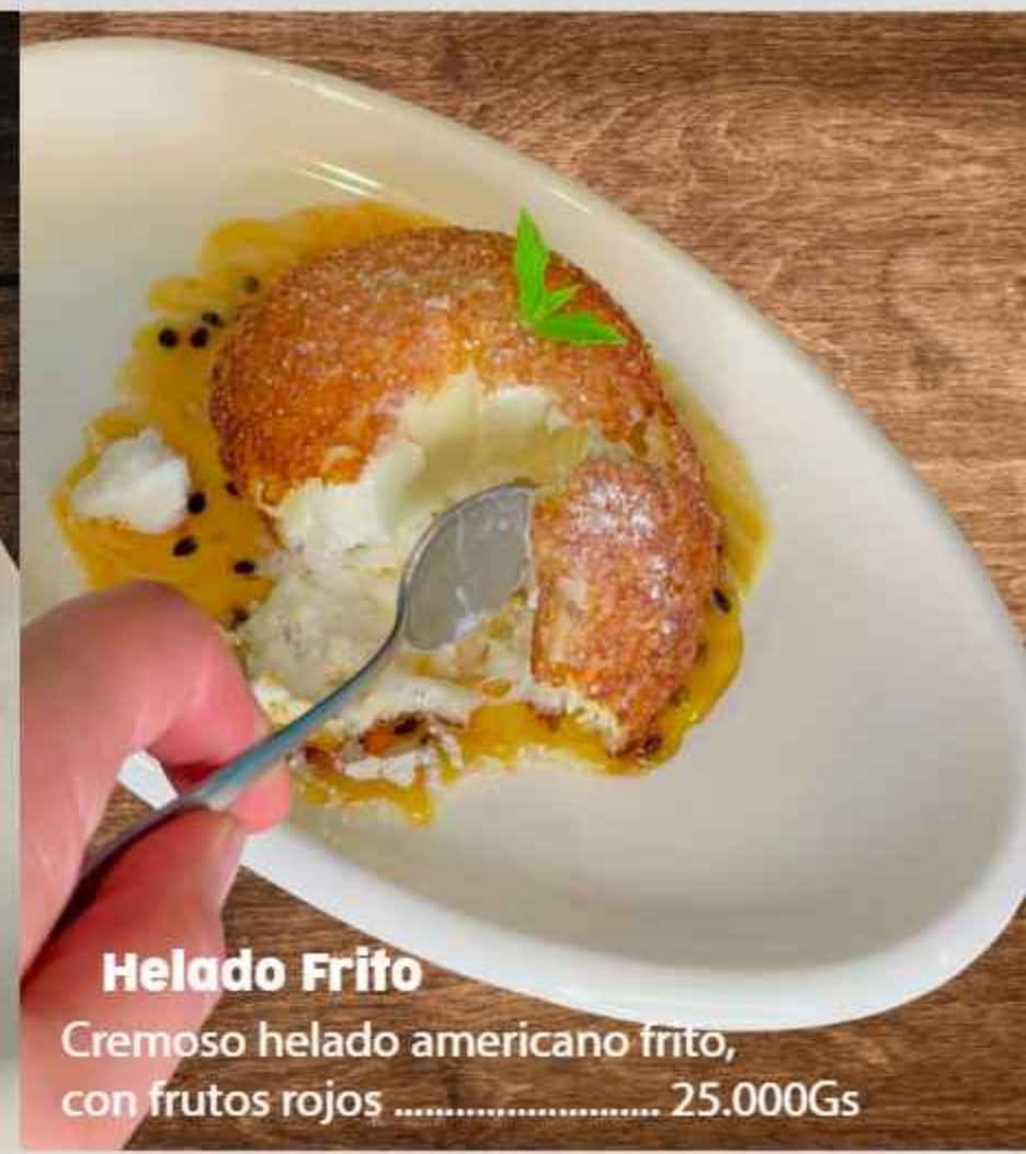
Helado Frito Cremoso helado americano frito, con frutos rojos ..... 25.000Gs