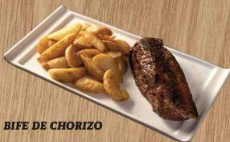
BIFE DE CHORIZO