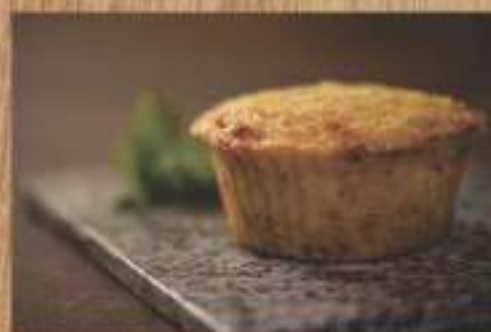
PAPAS FRITAS RUSTICAS ARRIERO CUP CAKE DE SOPA PARAGUAYA.