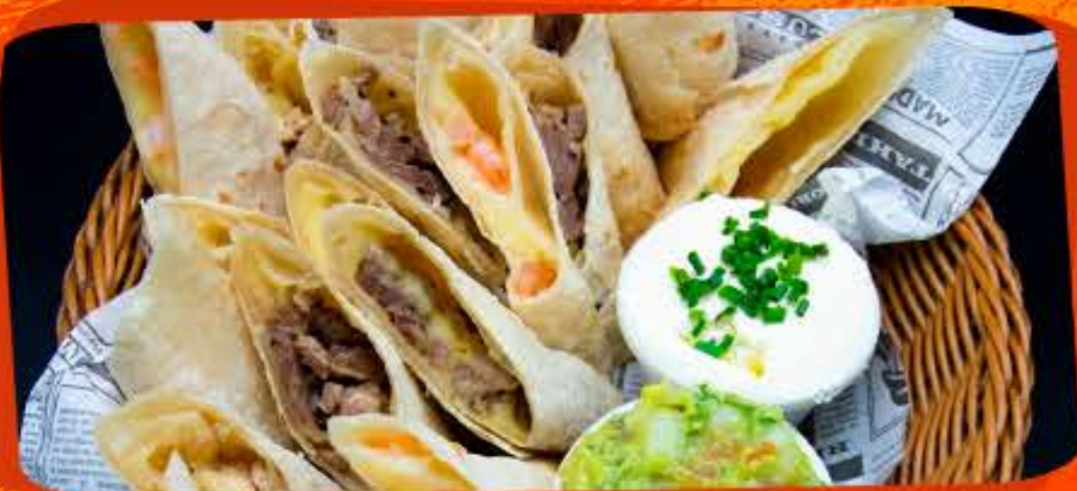
TABLA DE CARNES

TORTILLAS RELLENAS CON QUESO Y CARNE, POLLO, CAMARÓN O MIXTA, ACOMPAÑADO CON GUACAMOLE Y SOUR CREAM