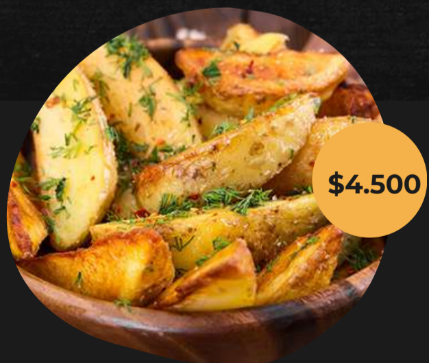
Papas fritas aromatizadas con romero y paprika.