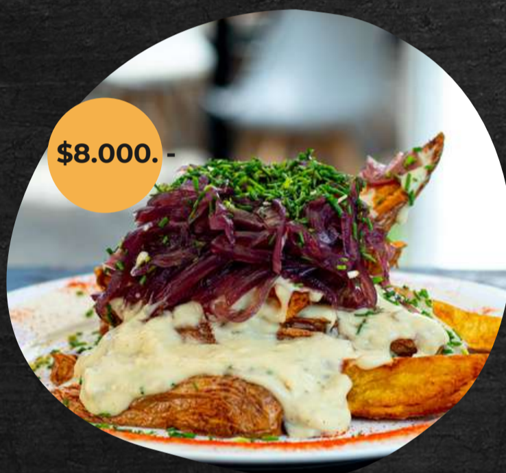
Papas fritas a la francesa aromatizadas con aceite de trufa bañadas con salsa de queso roquefor fundido, champiñones, mostaza dijon, cebolla al vino tinto y cibullette.