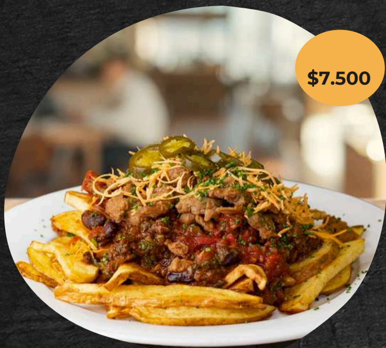
Cama de papas fritas, frijoles enchilados, chicken fake (pollo vegan), queso cheddar vegan, láminas de jalapeño y ciboulette finamente cortado.