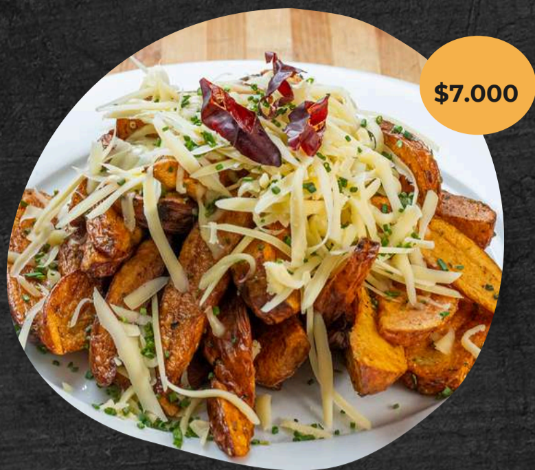
Papas fritas perfumadas con aceite de trufa negra, orégano griego, queso parmesano, ciboulette y anillos de ají cacho cabra ahumado. Para dos personas