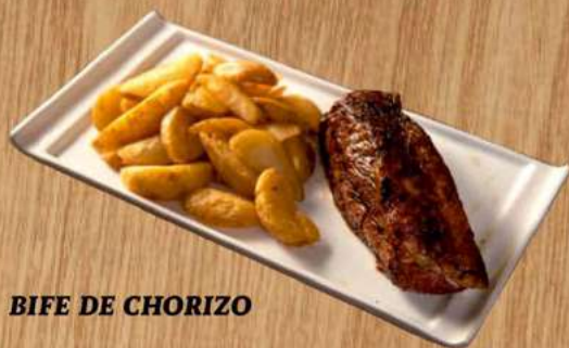
BIFE DE CHORIZO