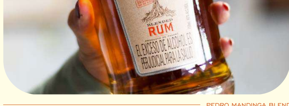
PEDRO MANDINGA BLEND