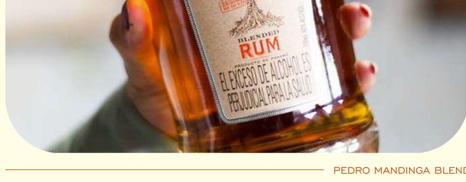
PEDRO MANDINGA BLEND