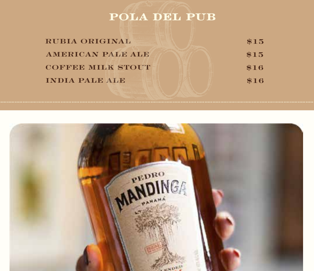
PICADA DEL RUM BAR