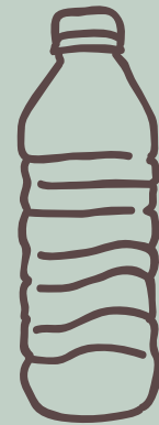
AGUA CON/SIN GAS $ 4,000