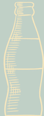
GASEOSAS *COCA COLA *COCA COLA ZERO *GINGER $ 3,500