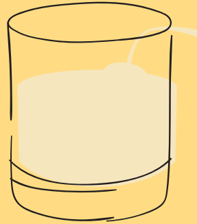
PISCO SOUR $ 25,000 (X2 PARA LICUAR EN CASA CON CUBOS DE HIELO)