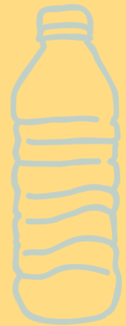
AGUA CON/SIN GAS $ 4,000