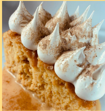
TORTA TRES LECHE DE AREQUIPE $ 6,000 - 20,000 - 30,000