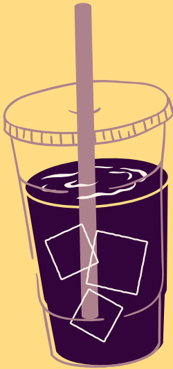
CHICHA MORADA 100% NATURAL $ 6,000