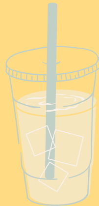
SANA TODO BEBIDA DE LA CASA A BASE DE LIMONARIA, MANZANILLA Y PIÑA $ 8,000