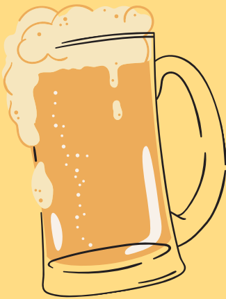
CERVEZAS *CLUB COLOMBIA 5,500 *IMPORTA DAS 8,500