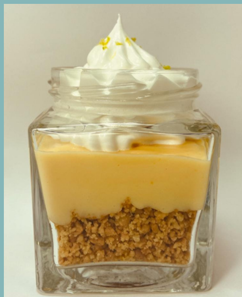
PYE DE LIMON $ 7,500 - 20,000 - 30,000