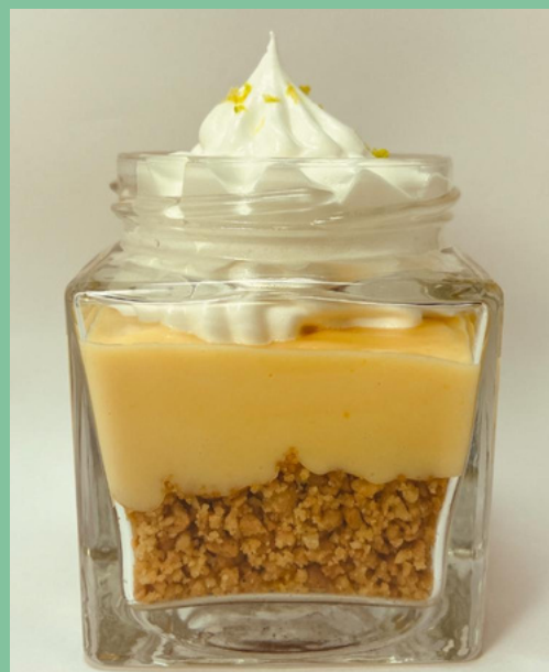
PYE DE LIMON $ 7,500 - 20,000 - 30,000