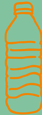
AGUA CON/SIN GAS $ 4,000