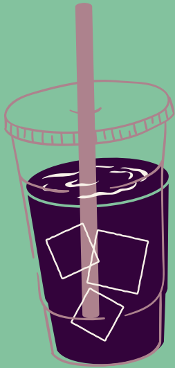
CHICHA MORADA 100% NATURAL $ 6,000