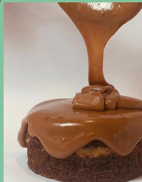
TORTA HUMEDA DE CHOCOLATE $ 7,500 - 20,000 - 30,000