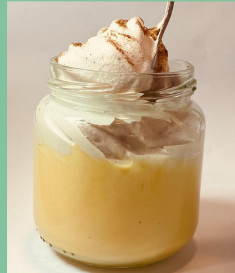
SUSPIRO LIMEÑO $ 7,500 - 20,000 - 30,000