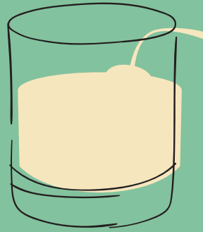
PISCO SOUR $ 25,000 (X2 PARA LICUAR EN CASA CON CUBOS DE HIELO)