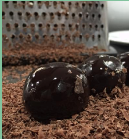
TRUFAS LIMEÑAS Uni: $ 2,000