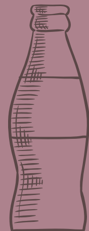
GASEOSAS *COCA COLA *COCA COLA ZERO *GINGER $ 3,500