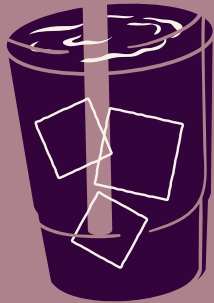
CHICHA MORADA 100% NATURAL $ 6,000