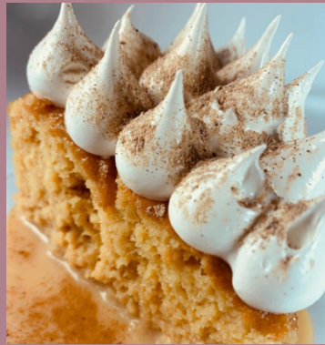
TORTA TRES LECHE DE AREQUIPE $ 6,000 - 20,000 - 30,000