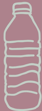
AGUA CON/SIN GAS $ 4,000