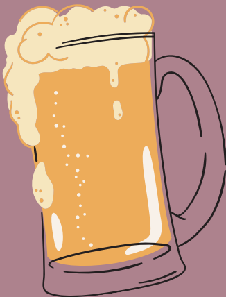
CERVEZAS *CLUB COLOMBIA 5,500 *IMPORTA DAS 8,500