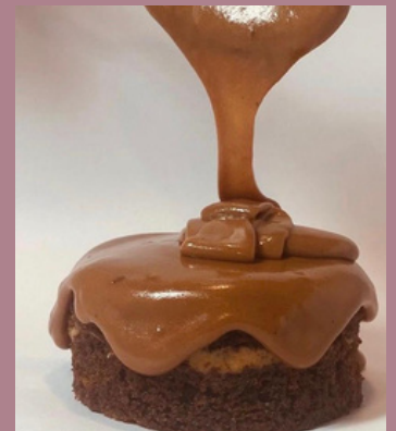
TORTA HUMEDA DE CHOCOLATE $ 6,000 - 20,000 - 30,000