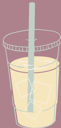
SANA TODO BEBIDA DE LA CASA A BASE DE LIMONARIA, MANZANILLA Y PIÑA $ 8,000