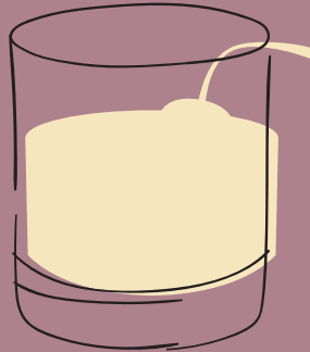
PISCO SOUR $ 25,000 (X2 PARA LICUAR EN CASA CON CUBOS DE HIELO)