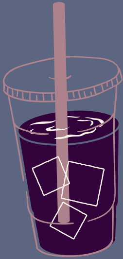
CHICHA MORADA 100% NATURAL $ 6,000