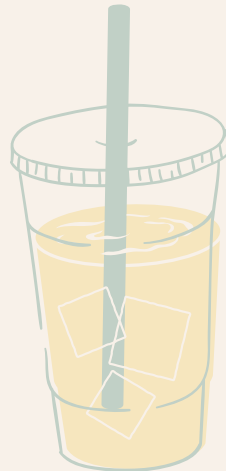
SANA TODO BEBIDA DE LA CASA A BASE DE LIMONARIA, MANZANILLA Y PIÑA $ 8,000