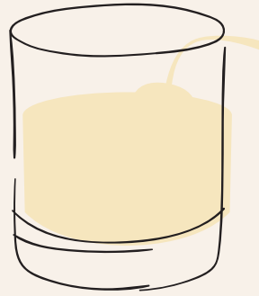
PISCO SOUR $ 25,000 (X2 PARA LICUAR EN CASA CON CUBOS DE HIELO)