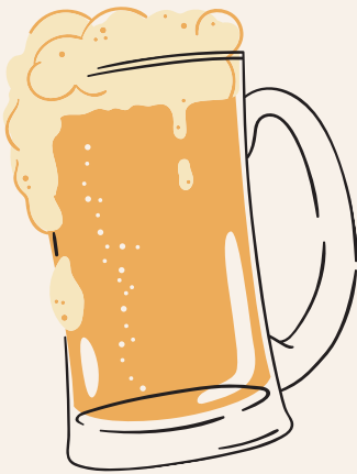
CERVEZAS *CLUB COLOMBIA 5,500 *IMPORTADAS 8,500