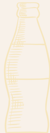
GASEOSAS *COCA COLA *COCA COLA ZERO *GINGER $ 3,500