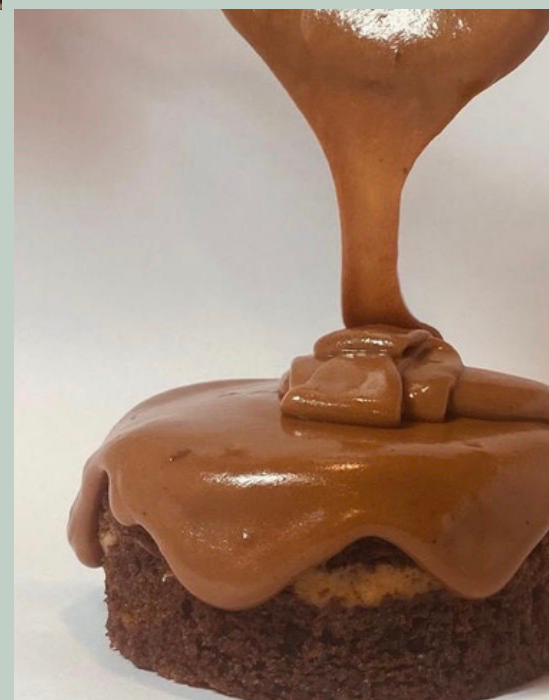
TORTA HUMEDA DE CHOCOLATE $ 6,000 - 20,000 - 30,000