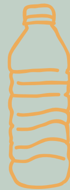
AGUA CON/SIN GAS $ 4,000