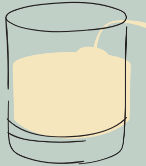
PISCO SOUR $ 25,000 (X2 PARA LICUAR EN CASA CON CUBOS DE HIELO)