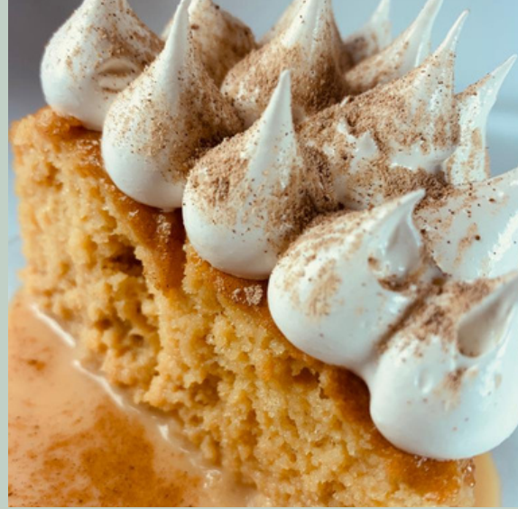
TORTA TRES LECHE DE AREQUIPE $ 6,000 - 20,000 - 30,000