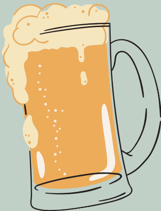
CERVEZAS *CLUB COLOMBIA 5,500 *IMPORTADAS 8,500