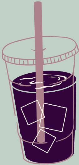
CHICHA MORADA 100% NATURAL $ 6,000