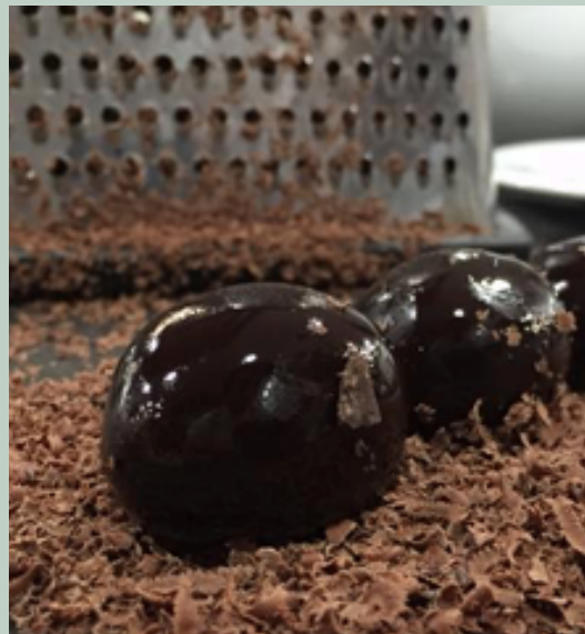
TRUFAS LIMEÑAS Uni: $ 2,000