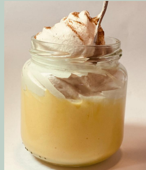
SUSPIRO LIMEÑO $ 6,000 - 20,000 - 30,000