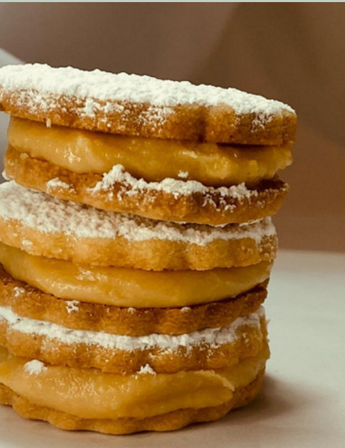
ALFAJORES Uni: $ 2,000