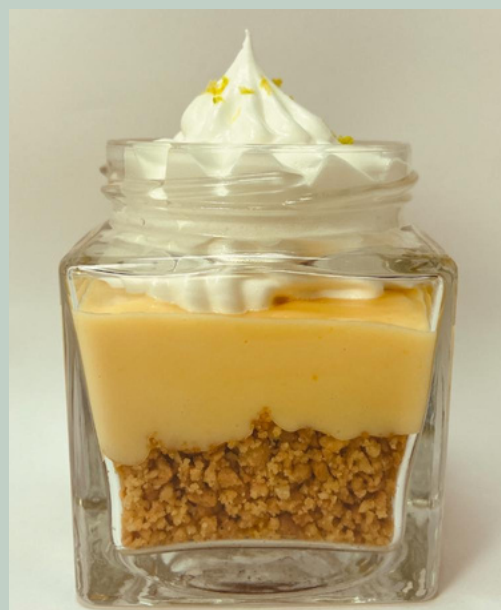
PYE DE LIMON $ 6,000 - 20,000 - 30,000