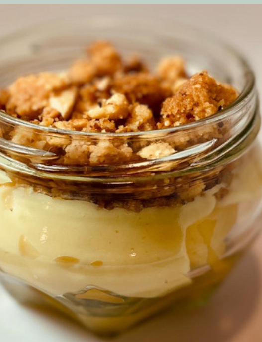
CROCANTE DE MANZANA $ 6,000 - 20,000 - 30,000