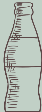
GASEOSAS *COCA COLA *COCA COLA ZERO *GINGER $ 3,500