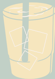
SANA TODO BEBIDA DE LA CASA A BASE DE LIMONARIA, MANZANILLA Y PIÑA $ 8,000