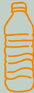
AGUA CON/SIN GAS $ 4,000