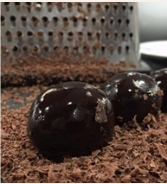
TRUFAS LIMEÑAS Uni: $ 2,000