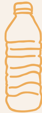
AGUA CON/SIN GAS $ 4,000