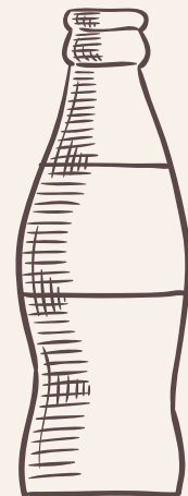
GASEOSAS *COCA COLA *COCA COLA ZERO *GINGER $ 3,500