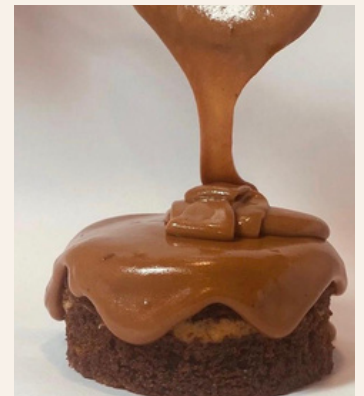
TORTA HUMEDA DE CHOCOLATE $ 6,000 - 20,000 - 30,000