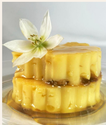
*CREMA VOLTEADA/FLAN DE CARAMELO $ 6,000 - 20,000 - 30,000