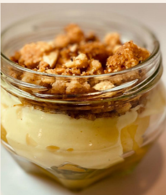
CROCANTE DE MANZANA $ 6,000 - 20,000 - 30,000