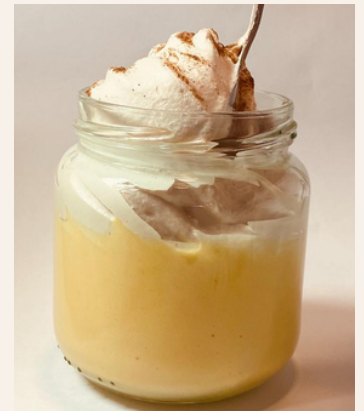
SUSPIRO LIMEÑO $ 6,000 - 20,000 - 30,000