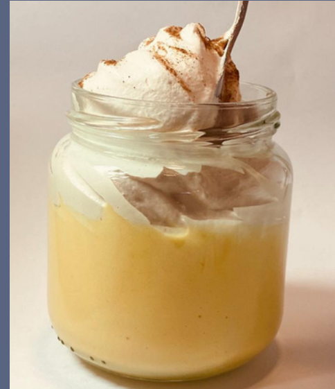
SUSPIRO LIMEÑO $ 6,000 - 20,000 - 30,000