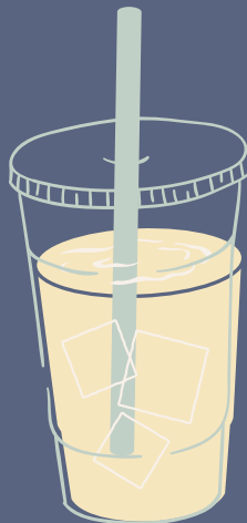
SANA TODO BEBIDA DE LA CASA A BASE DE LIMONARIA, MANZANILLA Y PIÑA $ 8,000