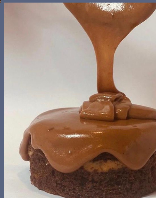
TORTA HUMEDA DE CHOCOLATE $ 6,000 - 20,000 - 30,000