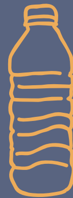
AGUA CON/SIN GAS $ 4,000