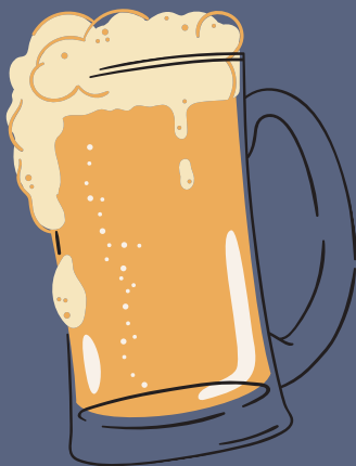
CERVEZAS *CLUB COLOMBIA 5,500 *IMPORTADAS 8,500