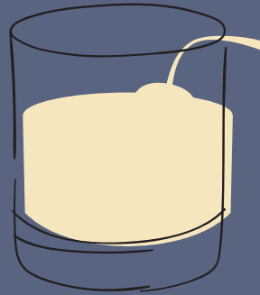
PISCO SOUR $ 25,000 (X2 PARA LICUAR EN CASA CON CUBOS DE HIELO)