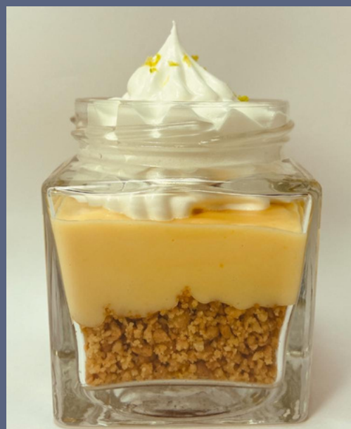
PYE DE LIMON $ 6,000 - 20,000 - 30,000