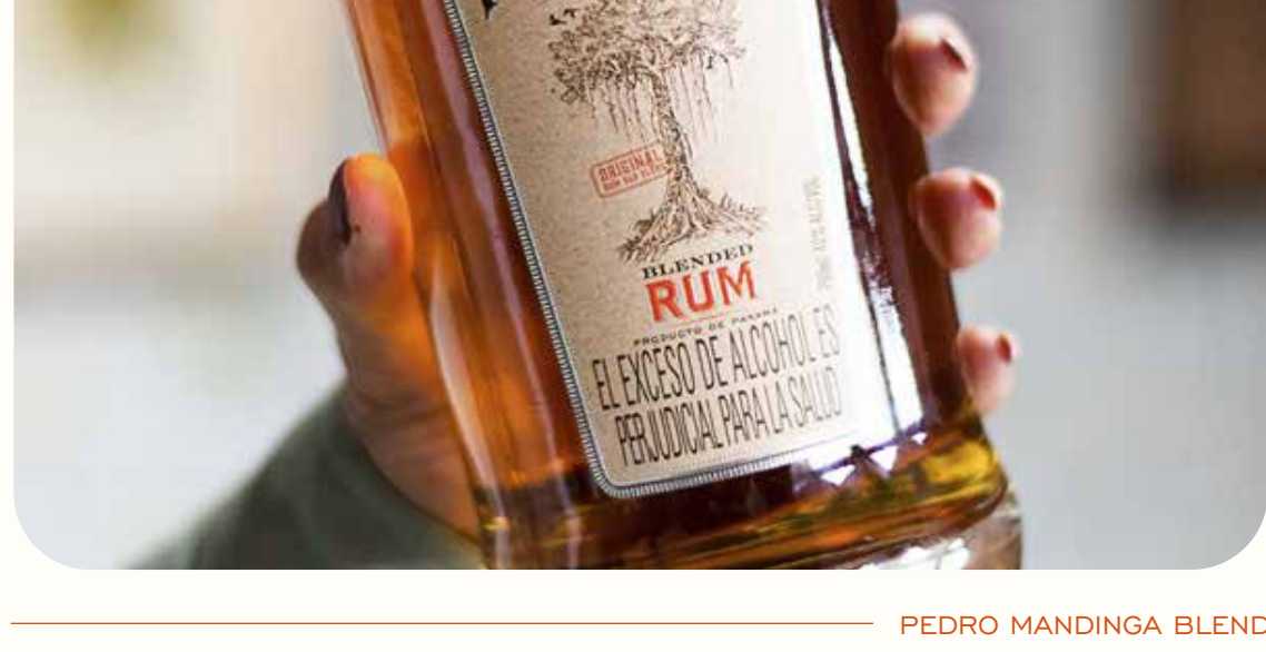
PEDRO MANDINGA BLEND