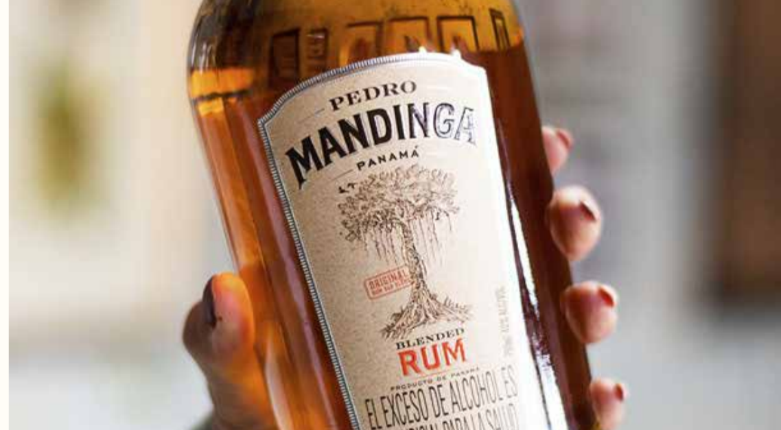
PEDRO MANDINGA BLEND