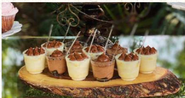
Shots 60 ml.

Observación: Todos los bocaditos unitarios salen a partir de 10 unidades.