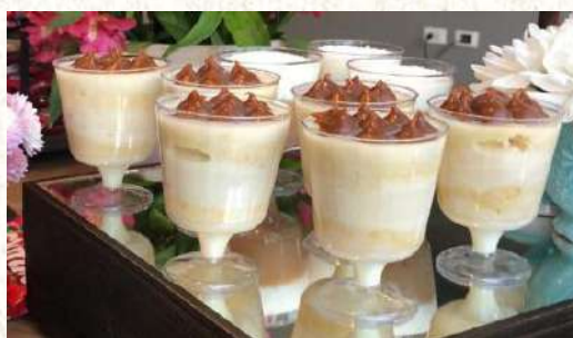
Copitas 130 ml.