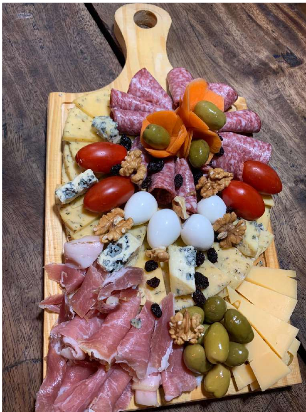
TABLA DE PICADAS para 2 personas

Variedad de jamones y quesos, aceitunas, huevos, frutos secos, tomates cherry