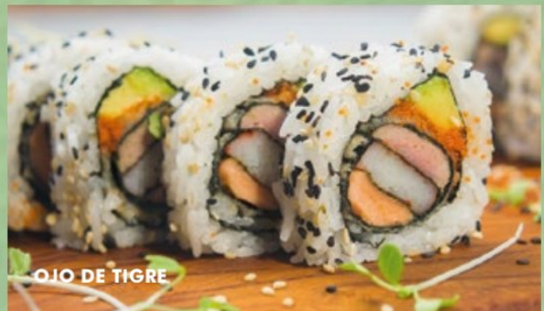
OJO DE TIGRE

6 bocados: $ 27.000 | 11 bocados: $ 39.000