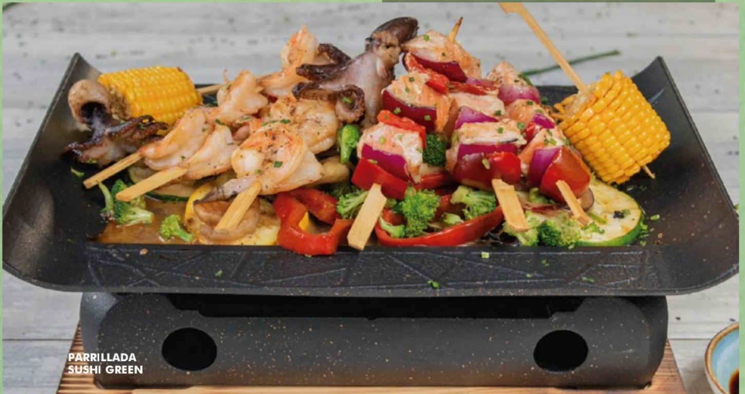
PARRILLADA SUSHI GREEN