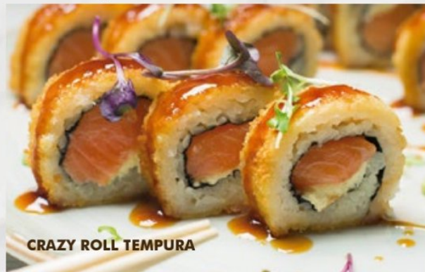
CRAZY ROLL TEMPURA