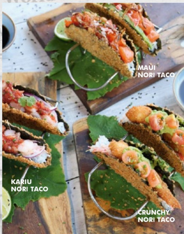
MAUI NORI TACO

Arroz de sushi, ensalada kanikama con salsa spicy mayo, envuelto en tempura al panko, con hojas de lechuga, laminas de aguacate, trozos de salmón fresco marinado, cubierto por salsa dinamita, teriyaki y semillas de ajonjolí negro.