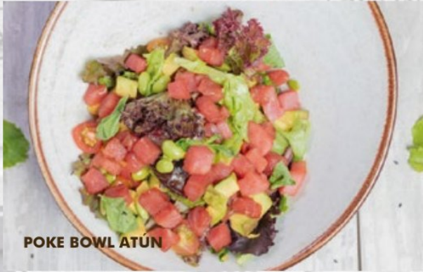
POKE BOWL ATÚN