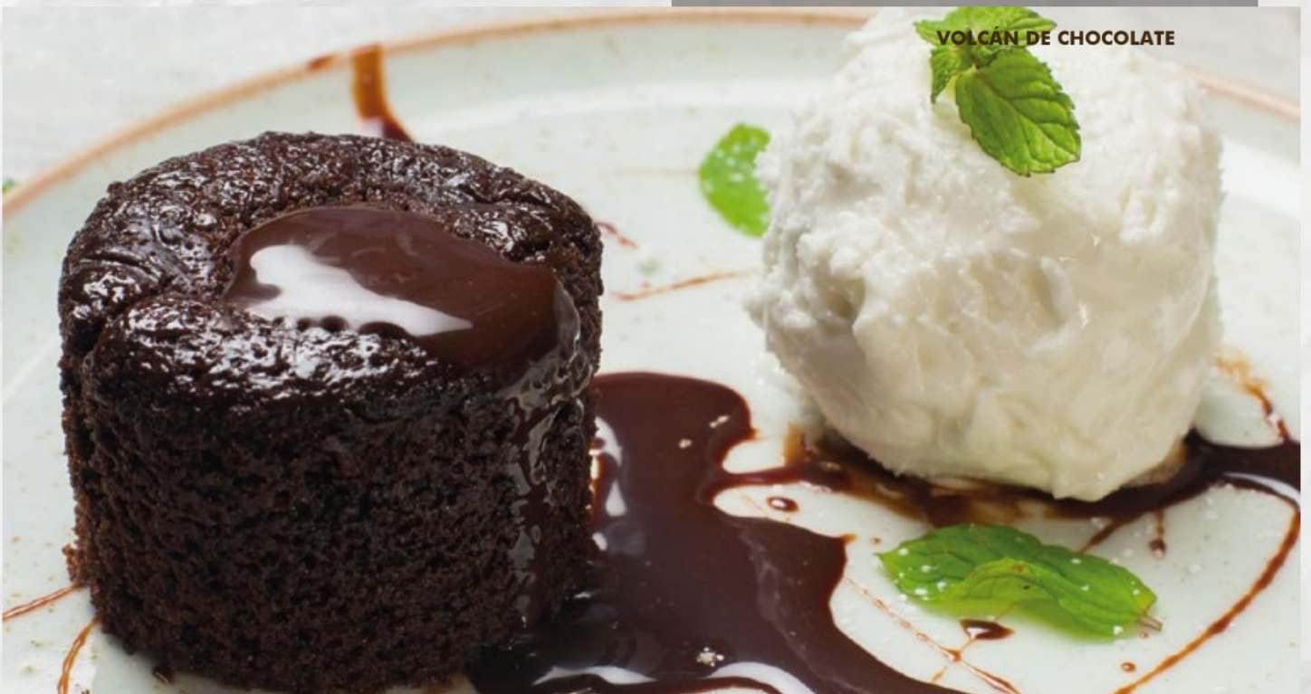
VOLCÁN DE CHOCOLATE