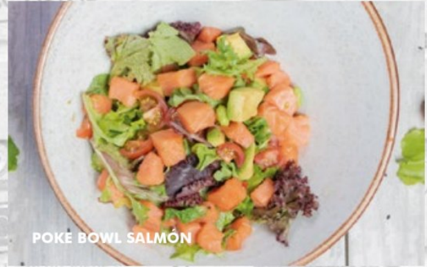
POKE BOWL SALMÓN

Atún fresco marinado en salsa soya, y aceite de ajonjolí, mix de lechugas, edamame, aguacate y ajonjolí negro, aromatizado con hierbabuena sobre una cama de arroz de sushi.