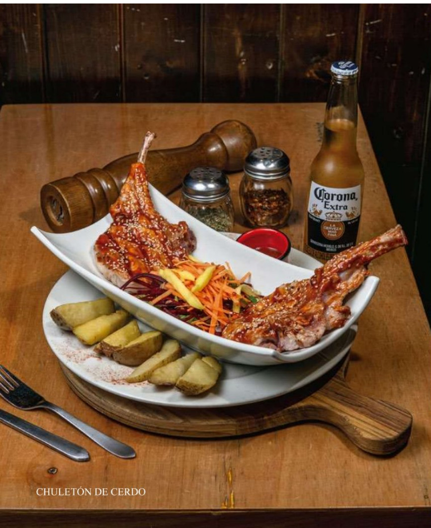
CHULETÓN DE CERDO

Salsa: Teriyaky - BBQ de Whisky BBQ de Brandy - BBQ de Chiplote