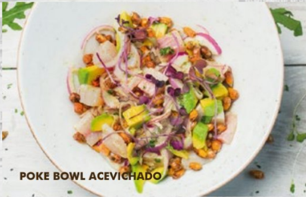
POKE BOWL ACEVICHADO

Corte de atún fresco marinado en soya y limón, kanikama, mix de lechugas, aguacate, zanahoria, ajonjolí negro y toping de cebolla crunch sobre una cama de arroz de sushi.