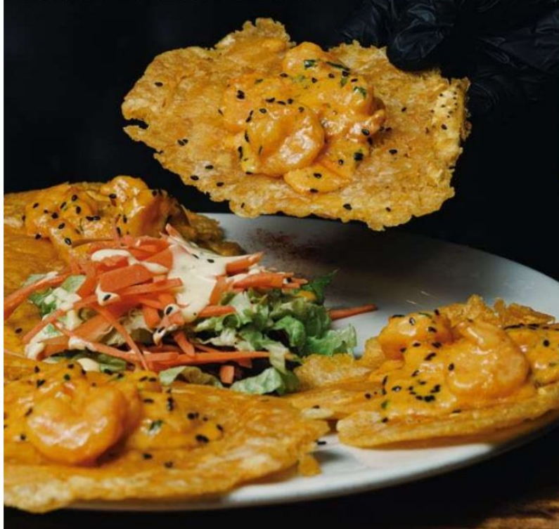
PATACONES CON CAMARONES AL AJILLO

150 g de pechuga de pollo a la parrilla, con vegetales frescos, queso de bufala, aderezado en salsa pesto y un delicioso pan brioche, con papas francesa.