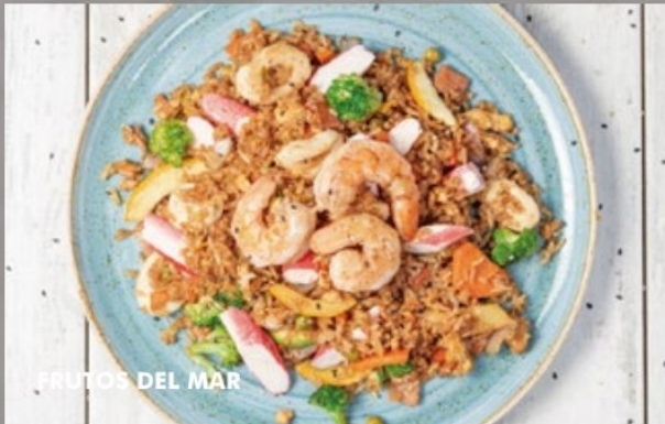
FRUTOS DEL MAR

Arroz yakimeshi, lomo viche, pechuga de pollo, langostinos cubiertos en salsa de la casa y variedad de verduras al estilo teppan con salsa teriyaki y ajonjolí blanco.