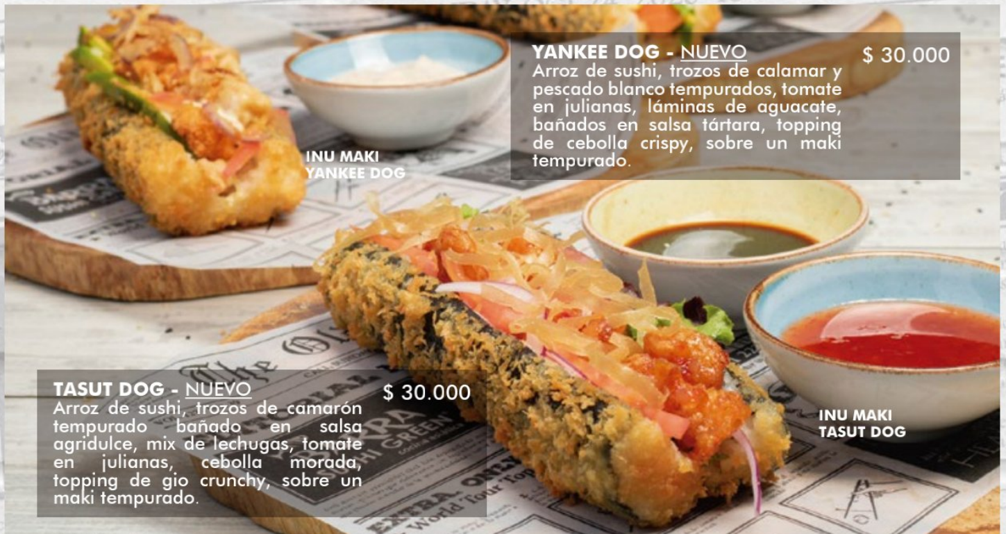
INU MAKI YANKEE DOG