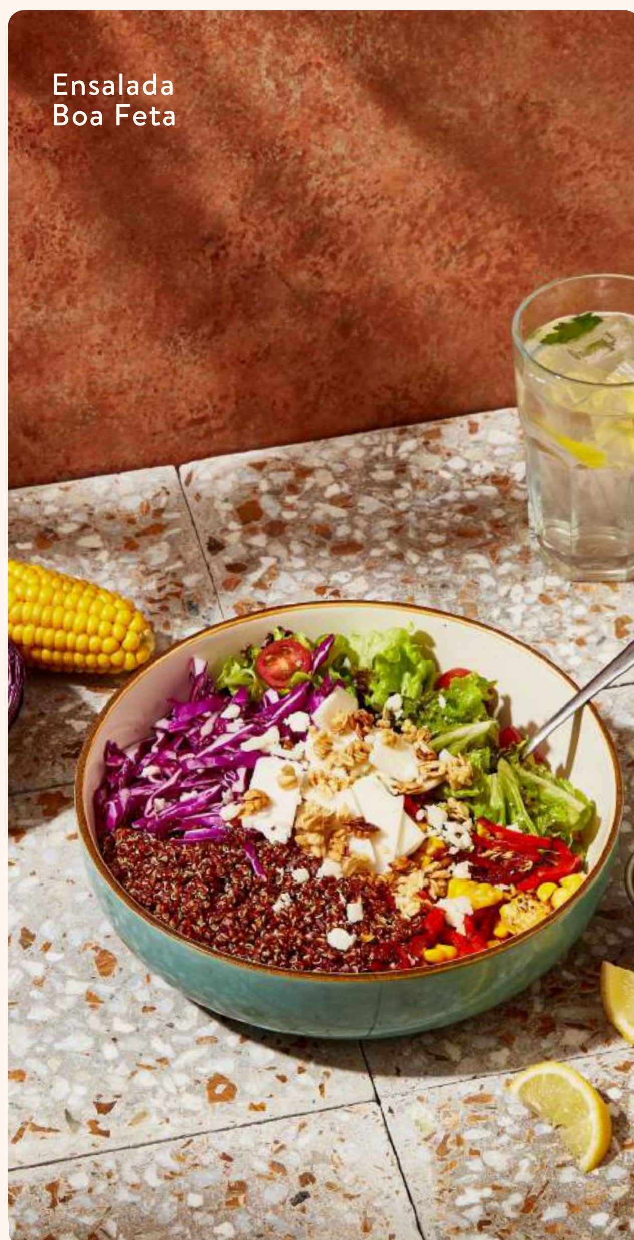
Ensalada Boa Feta

POKE TERIYAKI $5500 Arroz de sushi, pollo con salsa teriyaki, palta, zanahoria, rabanitos, cream cheese, mix de semillas + salsa ponzu.