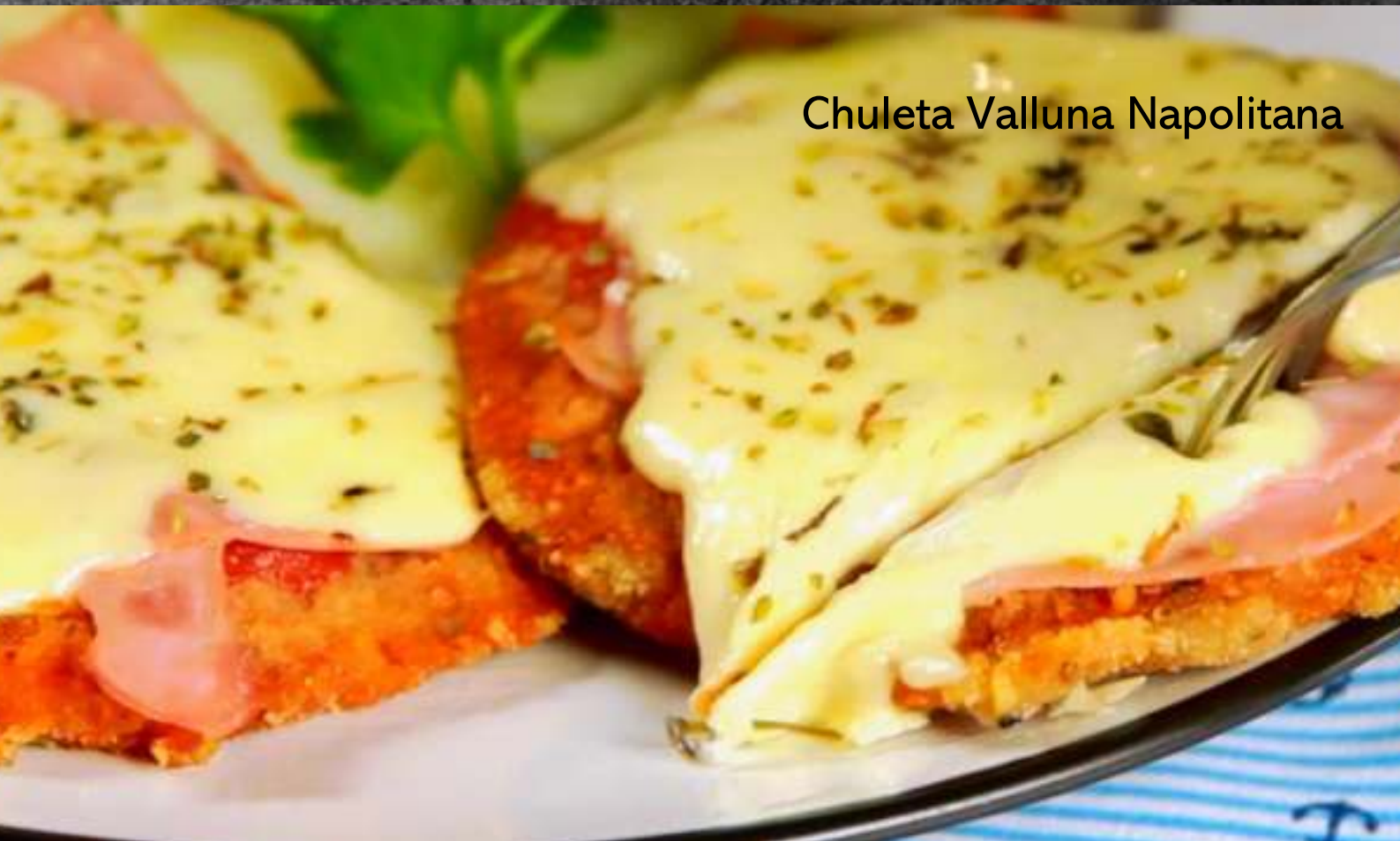
Chuleta Valluna Napolitana

500 gs de costillas de cerdo acompañada de papas rústicas