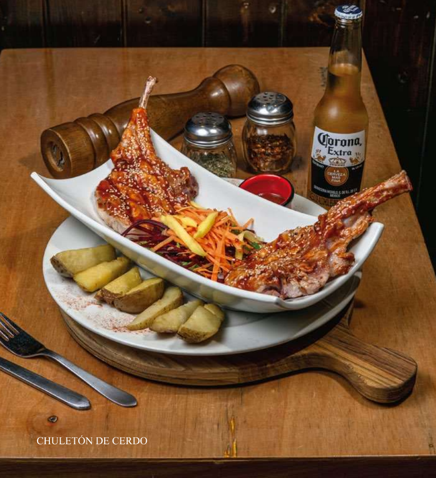
CHULETÓN DE CERDO