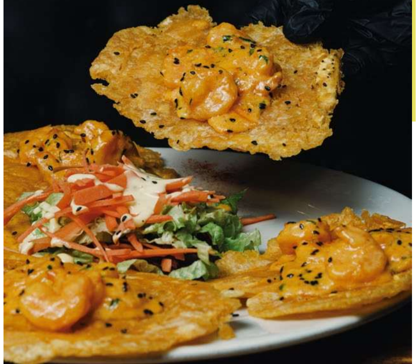
PATACONES CON CAMARONES AL AJILLO

150 g de pechuga de pollo a la parrilla, con vegetales frescos, queso de bufala, aderezado en salsa pesto y un delicioso pan brioche, con papas francesa.