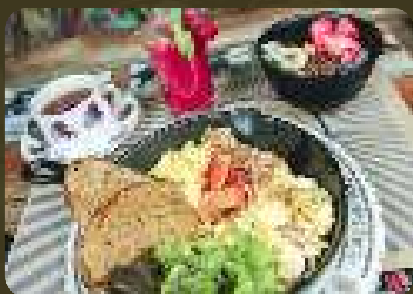
BREAKFAST IN AMERICA

AGREGADOS: TOCINO/QUESO/JAMÓN/CHAMPIÑÓN/CEBOLLA/TOMATE