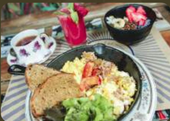
BREAKFAST IN AMERICA

AGREGADOS: TOCINO/QUESO/JAMÓN/CHAMPIÑÓN/CEBOLLA/TOMATE