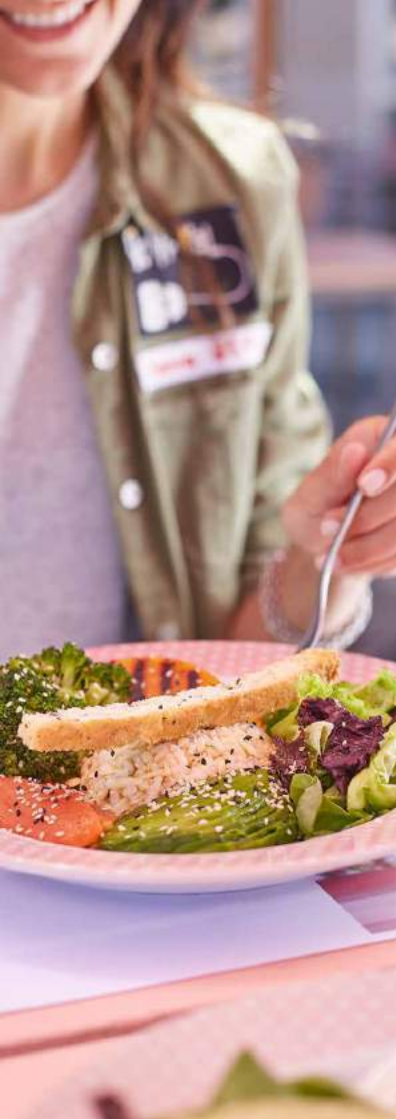
Ensalada Poke de Salmón