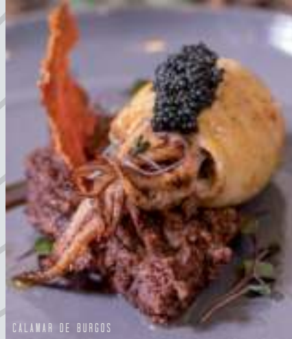
CALAMAR DE BURGOS