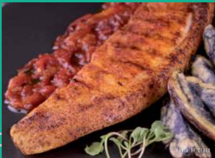
PUNTA DE CERDO