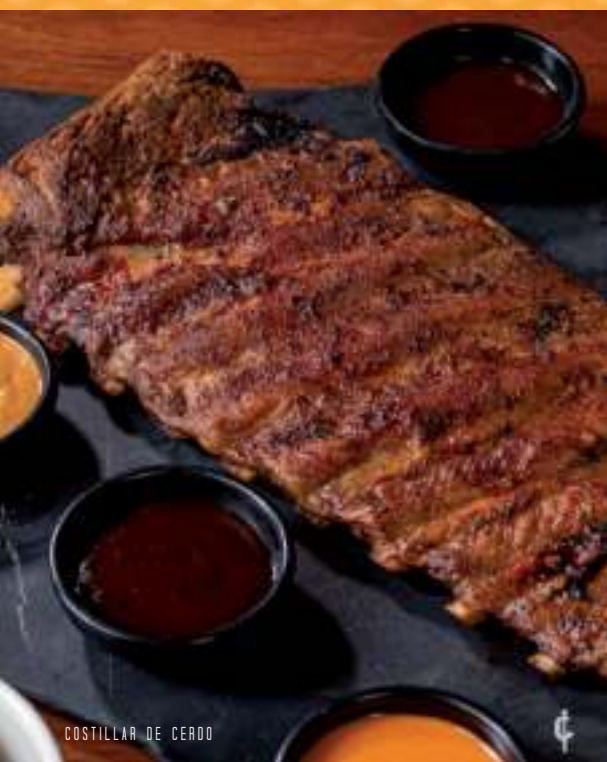
COSTILLAR DE CERDO