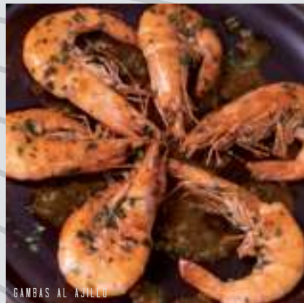
GAMBAS AL AJILLO