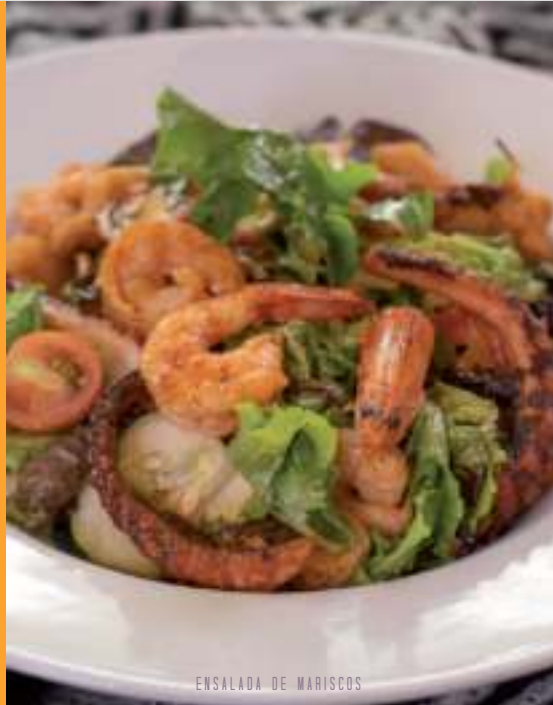
ENSALADA DE MARISCOS