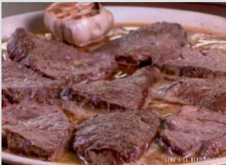
LOMO A LA MANTEQUILLA