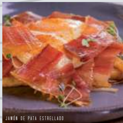
JAMÓN DE PATA ESTRELLADO