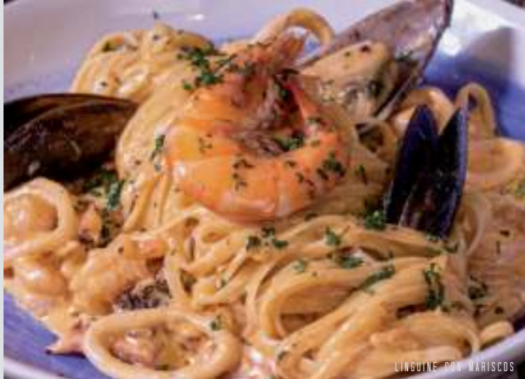
LINGUINE CON MARISCOS