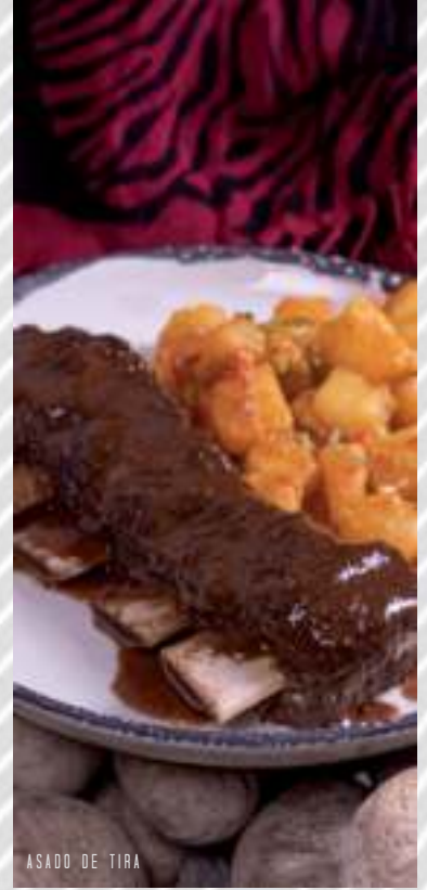
ASADO DE TIRA

En la descripción encontrará el peso en gramos (gr.) de la porción de carne de cada plato, la cual se toma antes de su cocción y varía durante la preparación, según el término de su elección.