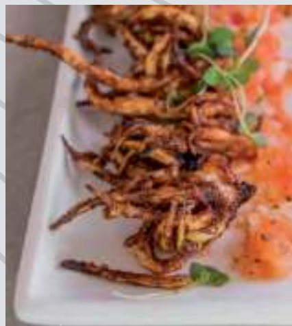
CHICHARRÓN DE CALAMAR