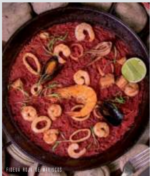
FIDEUÁ ROJA DE MARISCOS