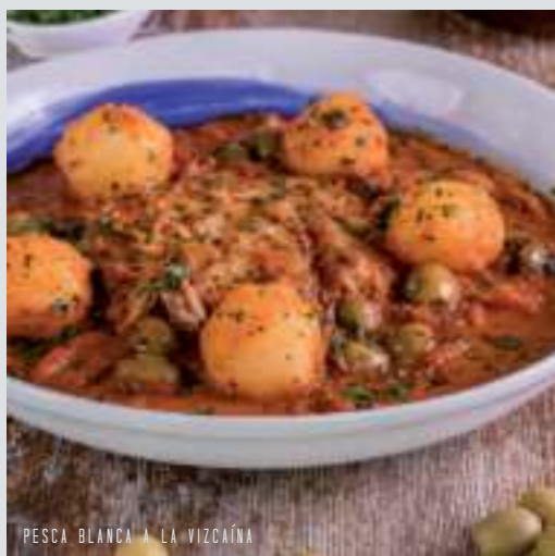
PESCA BLANCA A LA VIZCAÍNA