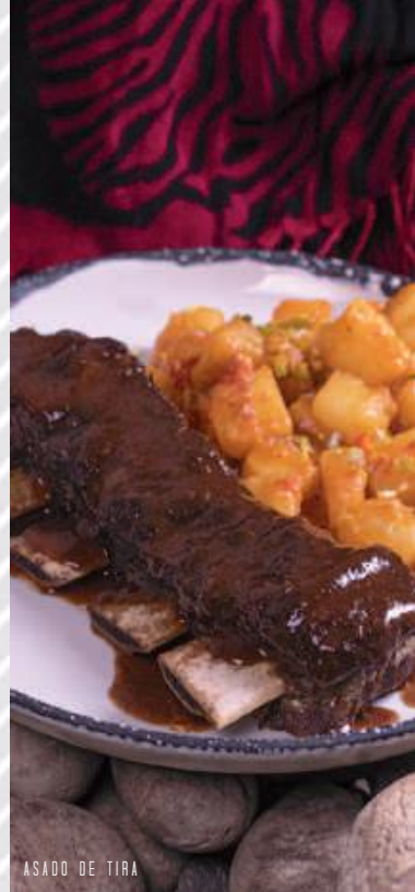
ASADO DE TIRA

En la descripción encontrará el peso en gramos (gr.) de la porción de carne de cada plato, la cual se toma antes de su cocción y varía durante la preparación, según el término de su elección.