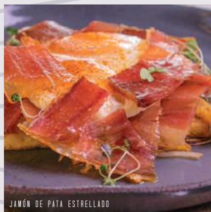
JAMÓN DE PATA ESTRELLADO