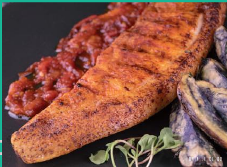
PUNTA DE CERDO