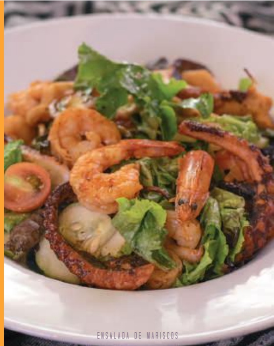
ENSALADA DE MARISCOS