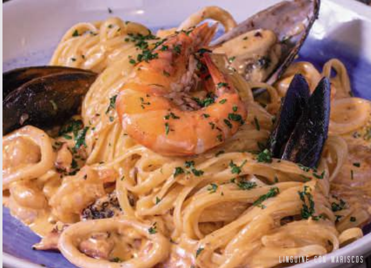
LINGUINE CON MARISCOS