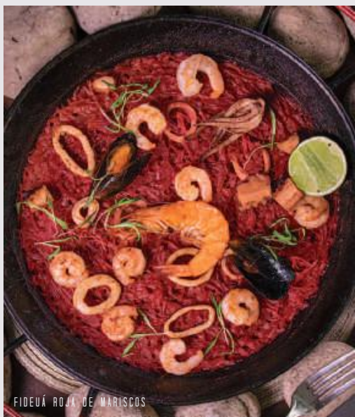
FIDEUÁ ROJA DE MARISCOS