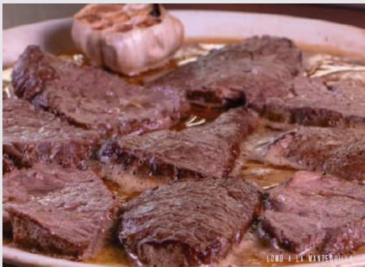
LOMO A LA MANTEQUILLA