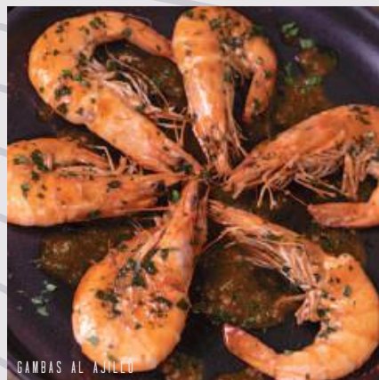
GAMBAS AL AJILLO