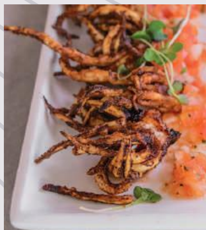
CHICHARRÓN DE CALAMAR