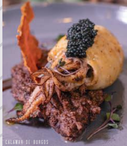
CALAMAR DE BURGOS