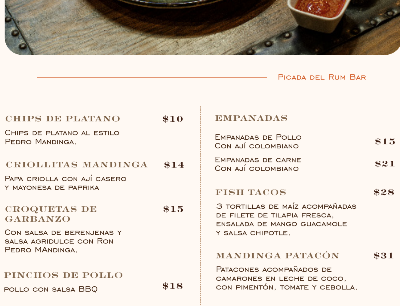
PICADA DEL RUM BAR