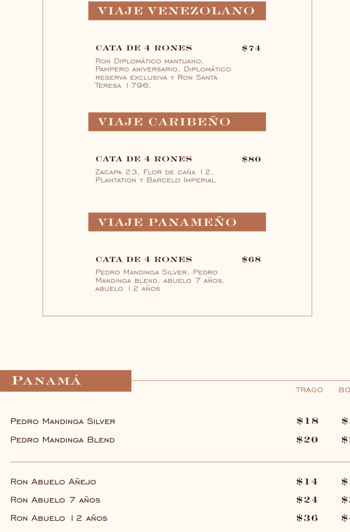
PEDRO MANDINGA BLEND