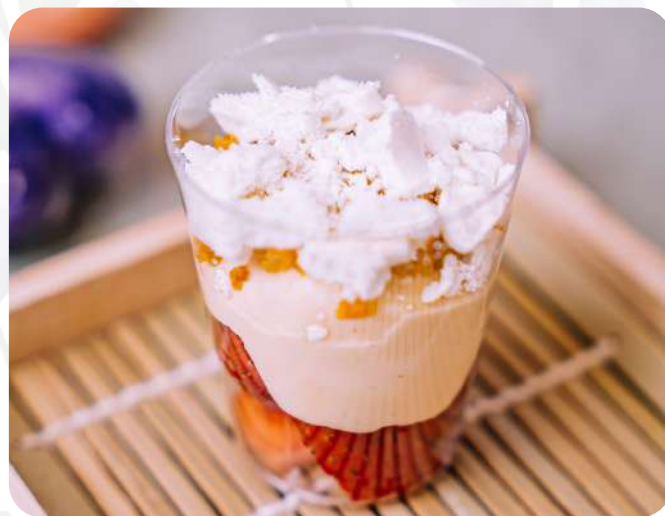
Merengado Fresas Fresas, suave crema de vainilla, merengue horneado.