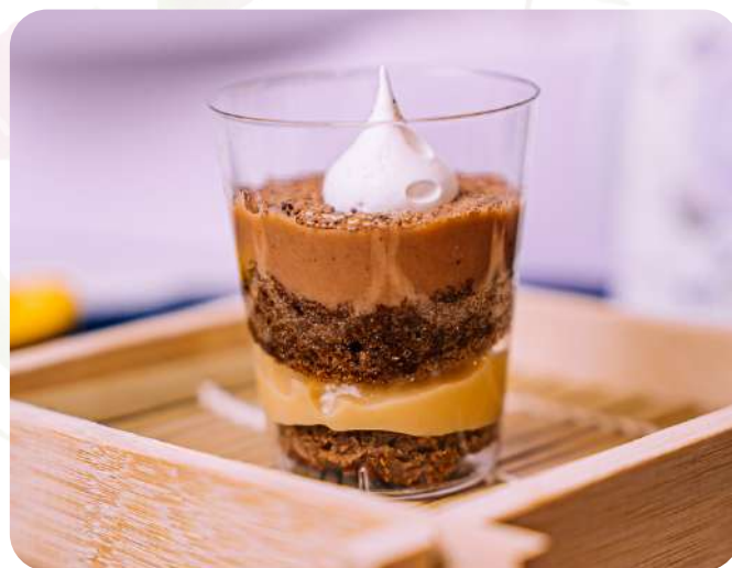
Torta de chocolate Muy aplaudido, con base esponjosa de chocolate y salsa encima.