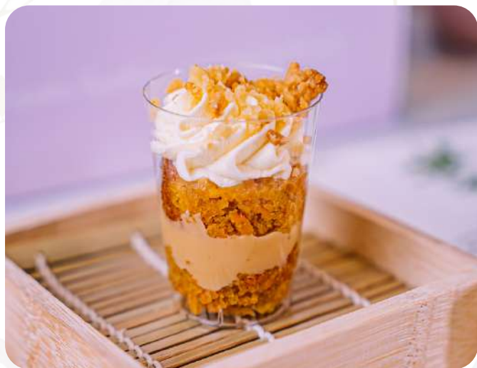
Torta Zanahoria Rellena de arequipe hecho en casa con crema de queso encima.