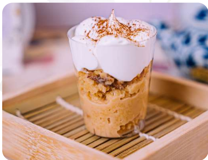
Suspiro Limeño Base de manjar casero, merengue de oporto.