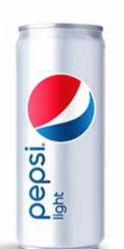
PEPSI LIGHT $1.500 310cc