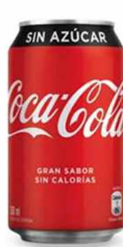
COCA COLA SABOR SIN AZÚCAR $1.500 Coca Cola sabor Sin Azúcar 330 cc