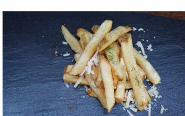
PAPAS FRITAS PARMESANO TRUFADO X1 $2.500 Papas Fritas Parmesano Trufado 150 grs