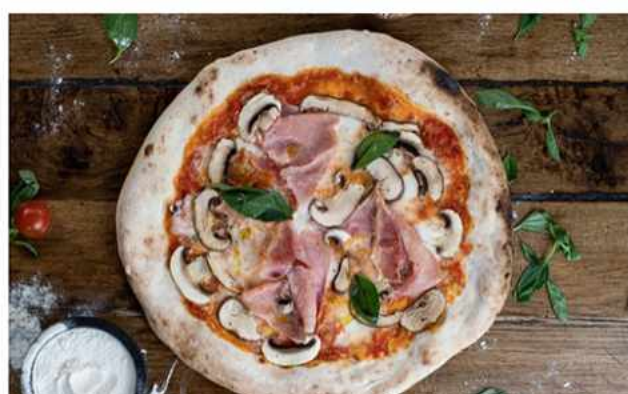
FUNGI & JAMÓN $10.600 Salsa podomoro casera, queso mozzarella foir di latte, láminas de jamón, mix de champiñones, hojas de...