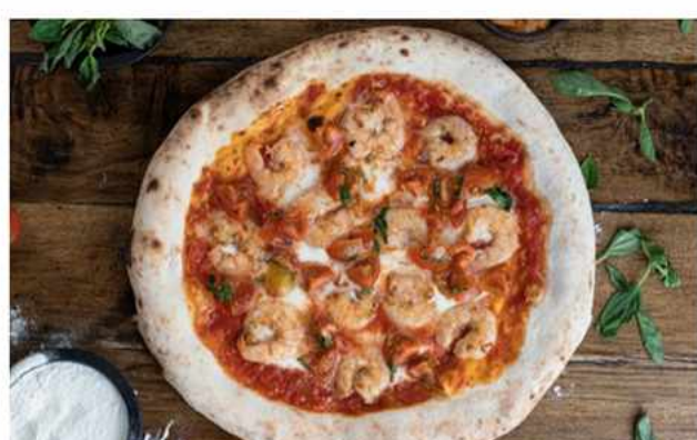
PIZZA CAMARÓN AL PIL-PIL $9.500 Salsa podomoro casera, queso mozzarella foir di latte, camarón al pil pil, tomates cherrys con albahaca...