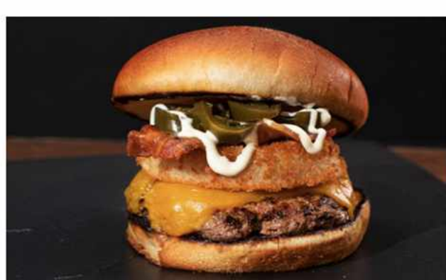
CRISPY BURGER $8.600 Salsa Alioli de la casa, aros de cebollas apanadas, tocino crocante, jalapeño, hamburguesa 100% de...