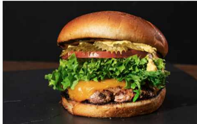
LA GRINGA BURGER $6.600 Salsa de Mostaza de la casa, mix de hojas, tomate, pepinillo dill ,hamburguesa 100% de vacuno 140 grs a...