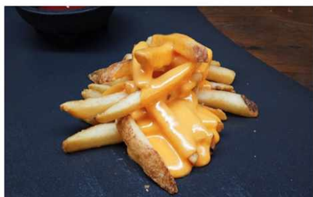
PAPAS FRITAS CHEDDAR X1 $2.500 Papas Fritas Cheddar Gratinado 150 grs