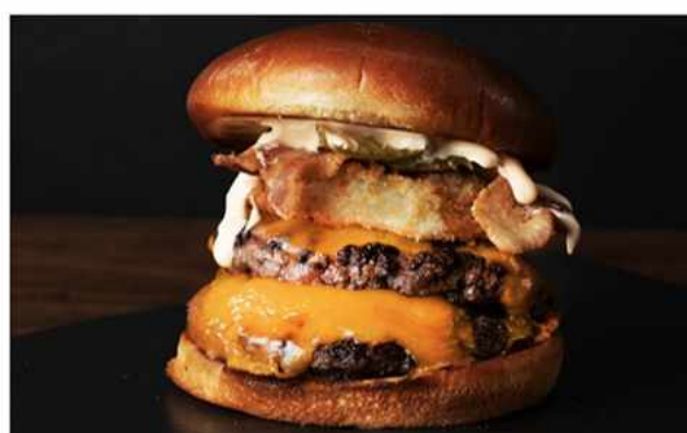
XL BURGER $11.800 Salsa picante sriracha, aros de cebollas apanadas, tocino crocante, pepinillos dill, doble queso...