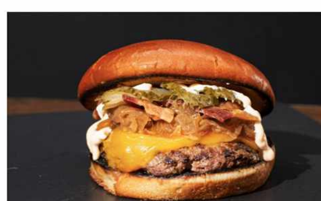
HOT & SWEET BURGER $8.600 Salsa sriracha de chiles madurados al sol, pepinillos dill, cebolla salteada y caramelizada, tocino...