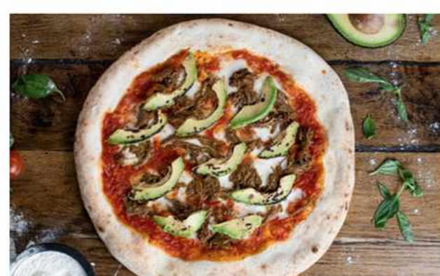
PIZZA MECHADA & PALT $10.600 Salsa podomoro casera, queso mozzarella foir di latte, carne desmechada, palta grillada y base al estilo...