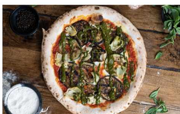
PIZZA VEGETARIANA $7.400 Salsa podomoro casera, queso mozzarella foir di latte, berenjenas y zapallo italiano asado,...