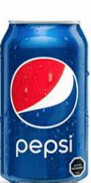
PEPSI $1.500 Pepsi 330 cc