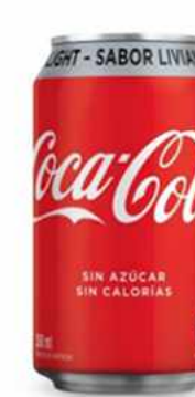
COCA COLA LIGHT $1.500 Coca Cola Light 330 cc

PEDIDOS AL: WHATSAPP: + 569 6835 6114 TELÉFONO: +562 2207 4480