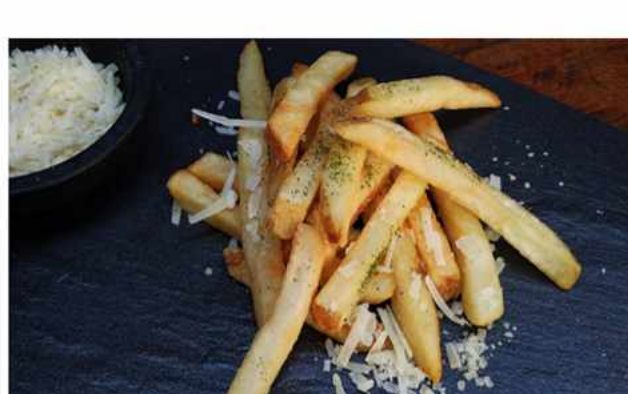
PAPAS FRITAS PARMESANO TRUFADO X2 $3.500 Papas Fritas Parmesano Trufado 200 grs