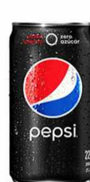
PEPSI ZERO $1.500 Pepsi Zero 330