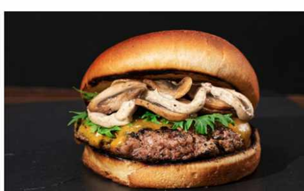
FUNGI TRUFADA BURGER $6.800 Salsa trufada, mix de hongos, láminas de Queso americano, hamburguesa 100% de vacuno de 140 grs 3 tipos...