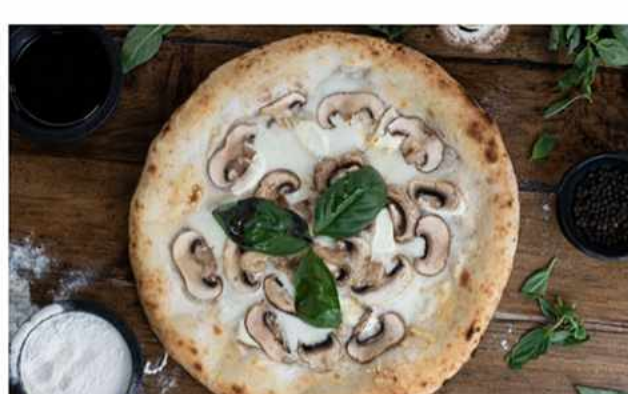
PIZZA TRUFADA $7.600 Queso foir di latte, queso crema, queso granapadano, mix de champiñones, hojas de albahaca fresca,...