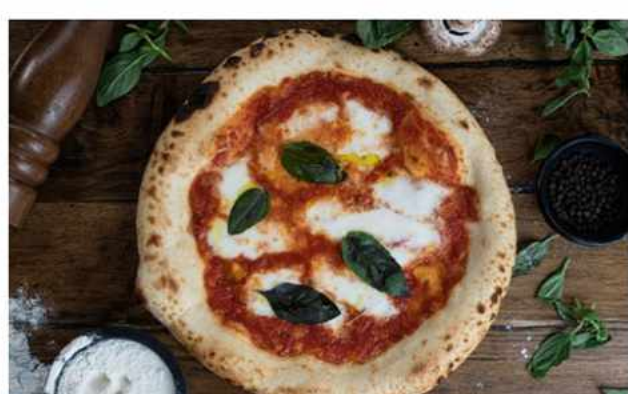
PIZZA MARGHERITA $6.900 Salsa podomoro de la casa, queso mozzarella foir di latte, hojas de albahaca fresca y base al estilo...