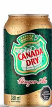
CANADA DRY $1.500 Canada Dry 330 cc