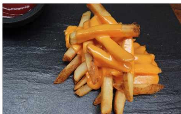
PAPAS FRITAS CHEDDAR X2 $3.500 Papas Fritas Cheddar Gratinado 250 grs