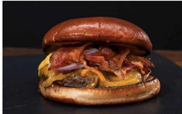
DOUBLE CHEESE BURGER $7.600 Salsa Alonso, doble queso americano, tocino crocante, aros de cebolla morada y nuestra hamburguesa 100%...