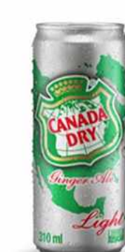
CANADA DRY LIGHT $1.500 Canada Dry 310 cc