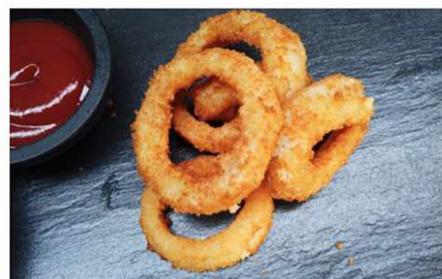
AROS DE CEBOLLAS 5 UNID $2.500 Aros de cebolla crocantes