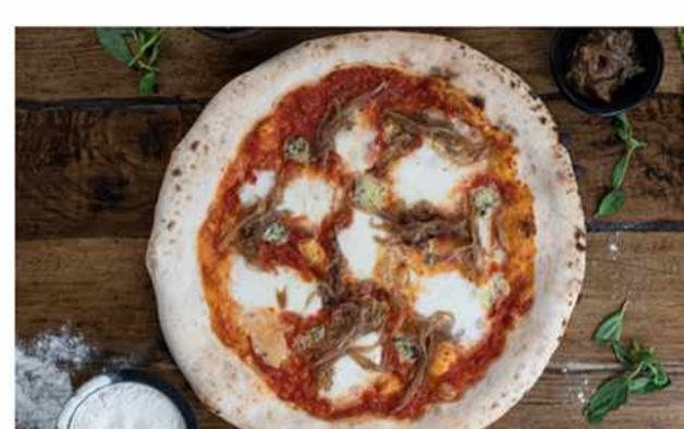
PIZZA QUESO AZUL Y CEBOLLA CARAMELIZADA $7.400 Salsa podomoro de la casa, queso mozzarella foir di latte, cebolla caramelizada, queso azul desmenuzado...