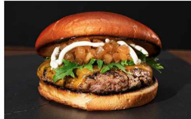
BLUE CHEESE BURGER $7.400 Salsa de queso azul de la casa, chutney de manzana verde, hamburguesa 100% de vacuno de 140 grs 3 tipos...