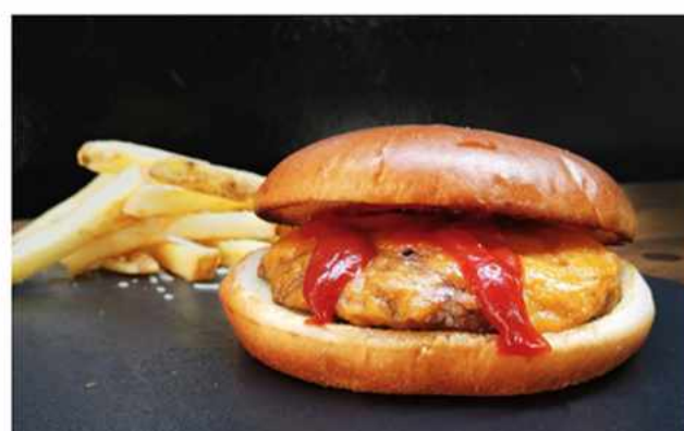
CHEESE BURGER $5.000 Queso americano, hamburguesa 100% de vacuno 140 grs a base de 3 tipos de cortes.