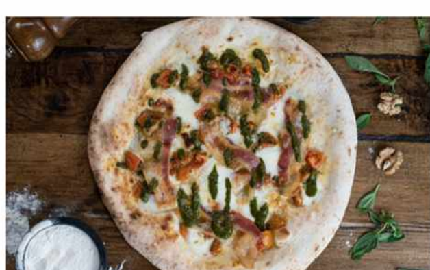
PIZZA TOCINO PESTO $7.800 Queso foir di latte, queso granapadano, tomates cherrys, albahaca fresca, tocino, salsa pesto en masa...