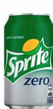
SPRITE ZERO $1.500 Sprite zero 330 cc