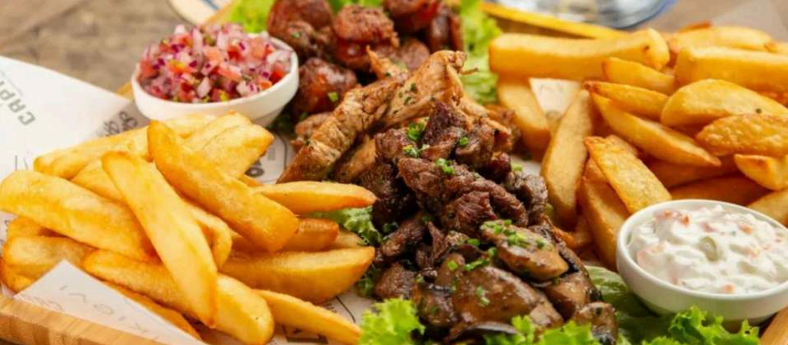
TABLA PARA COMPARTIR