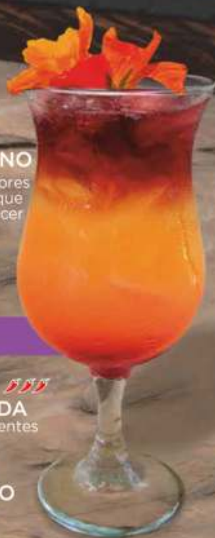
ATARDECER PERUANO Su mezcla de sabores y colores son toda una experiencia que nos transporta a un atardecer en Perú. $23.000