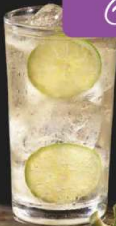
CHILCANO Cóctel típico peruano a base de pisco y ginger ale. - CLÁSICO $21.000 - LIMONARIA $21.000 - JENGIBRE $21.000