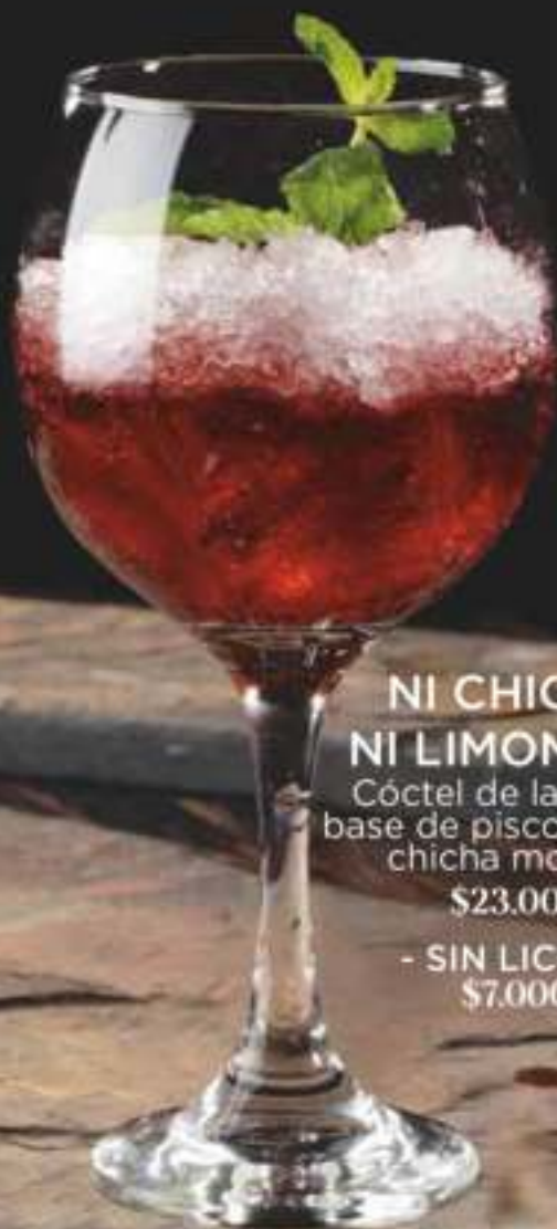
NI CHICHA NI LIMONADA Cóctel de la casa a base de pisco, limón y chicha morada $23.000 - SIN LICOR: $7.000