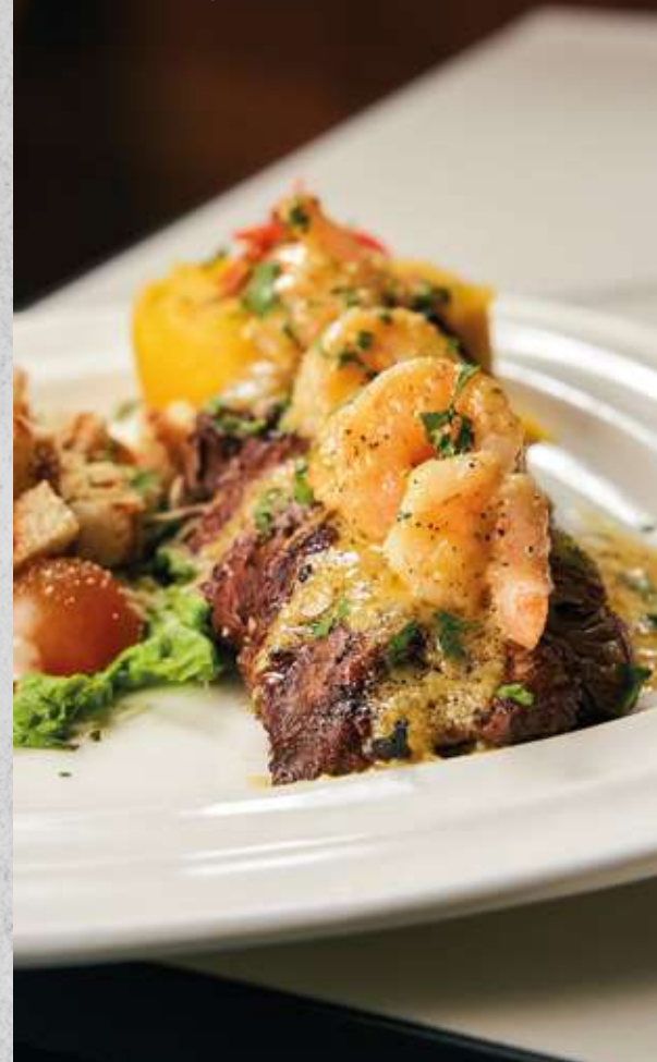
Cuadril e Rigatoni