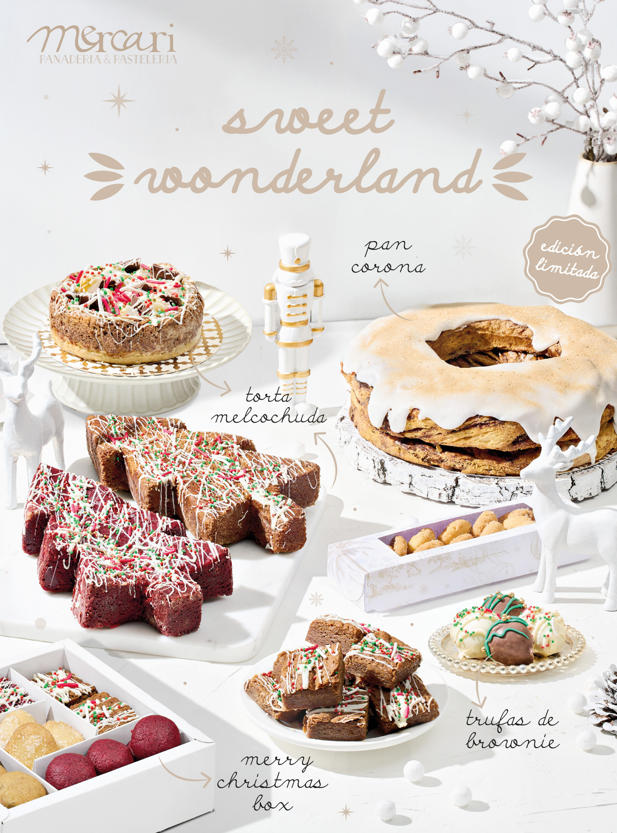
merry christmas box