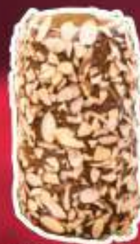
KURTO DE NUTELLA Y ALMENDRAS