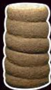
KURTO DE OREO