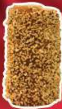
KURTO DE MANI Y AREQUIPE