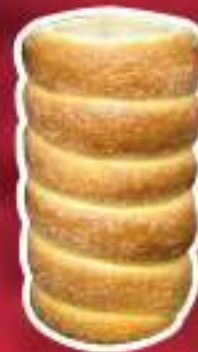
KURTO DE CANELA