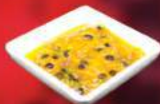
UCHUYA - MARACUYÁ