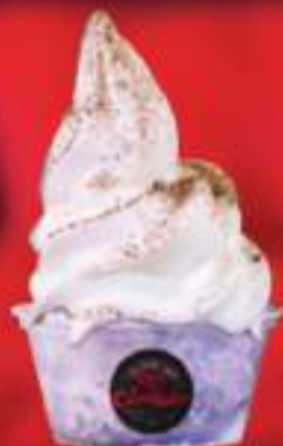
HELADO $ 3 K