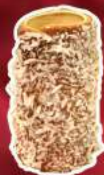
KURTO DE COCO Y AREQUIPE