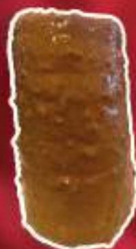
KURTO CARAMELO AVELLANAS