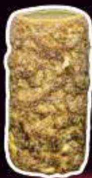
KURTO DE ALMENDRAS