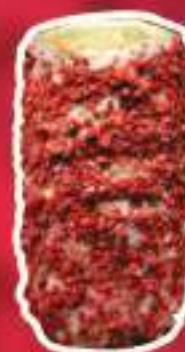
KURTO DE RED VELVET