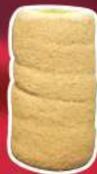
KURTO DE MLO