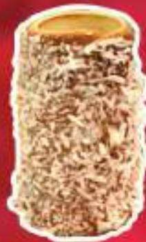
KURTO DE COCO Y NUTELLA