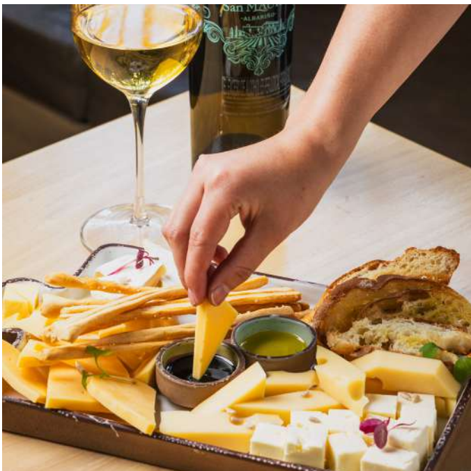
Tabla de quesos europeos

Zebra tomatoes sautéed in herbs, flambéed burrata, ciabatta bread and seasonal sprouts